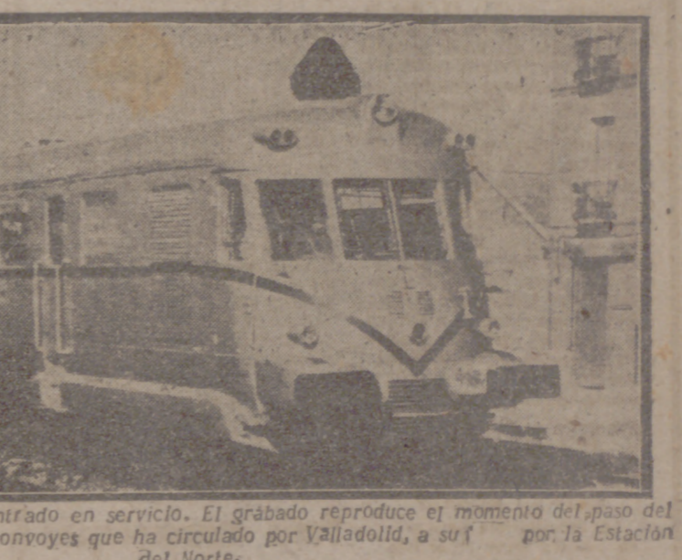
Los nuevos coches TAF han entrado en servicio. El grabado reproduce el momento del paso del primero de estos llamantes convoyes que ha circulado por Valladolid, a su paso por la Estación del Norte.