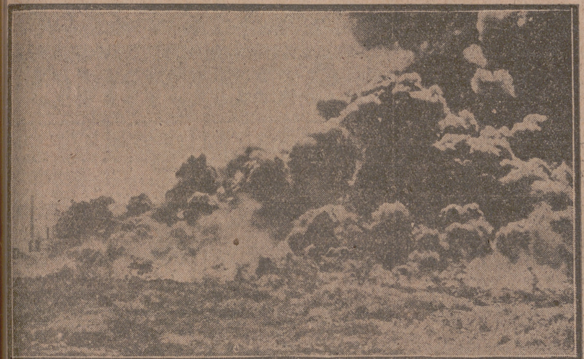
Un momento del impresionante incendio que ha originado daños cuantiosísimos en los depósitos y refinerías de petróleo de Corpus Christi, en Texas. Fueron evacuadas 500 familias y ocho bomberos resultaron heridos.