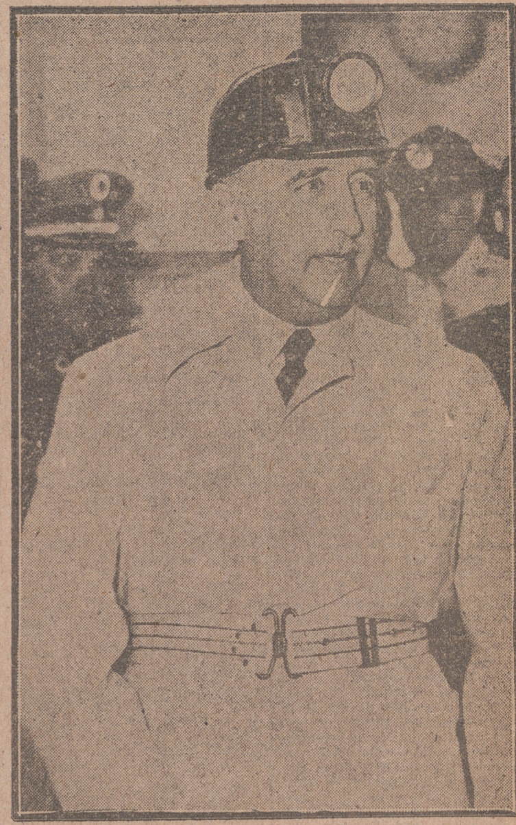
S. E. el Jefe de Estado, con el traje típico de minero, se dispone a tomar el ascensor para bajar a uno de los pozos de explotación de pizarra, durante su visita, acompañada de los ministros del Gobierno y otras personalidades, a las instalaciones industriales de Puertollano. ABAJO: El alcalde de la ciudad impone la Medalla de Oro a Su Excelencia el Jefe del Estado, con motivo de su estancia en la misma para inaugurar el Complejo Industrial.

Washington, 21.—La Cámara de Representantes ha aprobado en votación oral en principio el proyecto de ley de seguridad mutua, tras seis horas de debate, despidiendo así el camino para la aprobación definitiva de la misma.—Efe.