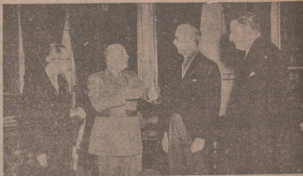
MADRID.—Su Excelencia el jefe del Estado, acompañado del ministro de Asuntos Exteriores, señor Martín Artajo, durante la audiencia concedida al ministro de Relaciones Exteriores de Venezuela, acompañado del embajador de su país en Madrid.