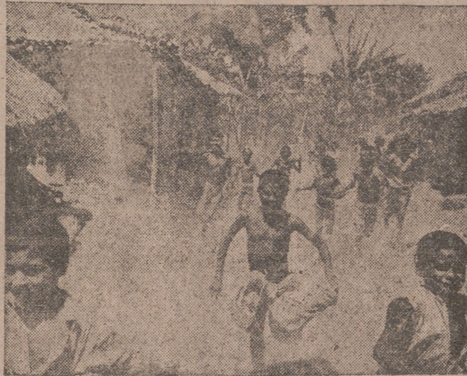
En esas chozas de barro viven los campesinos, cuyos hijos, casi desnudos, se apresuran a contemplar el paso de un automóvil, cosa sorprendente para ellos

Madras.—Al comenzar el año 1947, se produjo en la India un hecho sensacional. En la región en que habitan los Teliguas, es decir, en la parte este de Hindurabad, los campesinos comenzaron a apoderarse de las tierras. La sed de acción se apoderó inesperadamente de aquellos esqueléticos fantasmas que pueblan el campo indio. Comenzaron invadiendo las grandes propiedades, las grandes haciendas, asesinaron a los propietarios y a los usureros más crueles y seguidamente organizaron por sí mismos la administración de la provincia.