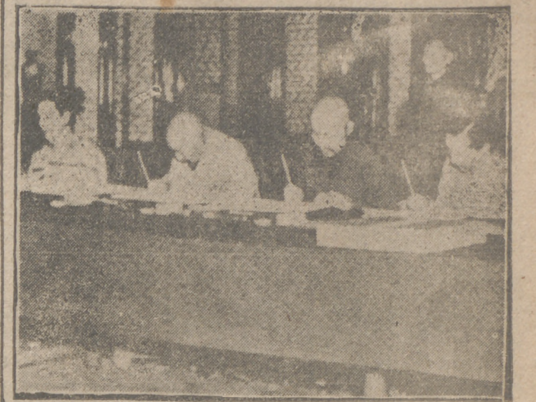
Los delegados tibetanos y los de la China comunista, reunidos en el antiguo palacio Imperial de Pekín, han firmado un tratado por el que el Tibet se considera “liberado pacíficamente”.

Tokio, 17. — La Policía que vigila la residencia del primer ministro nipón ha detenido a un hombre que vagabundaba por los alrededores de la residencia. Las investigaciones llevadas a cabo han demostrado que el sospechoso es Mathuzo Marimaki, de 45 años de edad, “mendigo profesional con 36 años de carrera”. Durante su “carrera” amasó una fortuna de cinco millones de yens. —Efe.