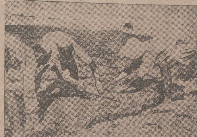
Sobre las arenas del desierto de Jericó, los judíos levantan un nuevo pueblo para hacer frente a los problemas que plantean las oleadas de inmigrantes que llegan a Israel

"Que mi mano derecha se seque si te olvido, JERUSALEN!"