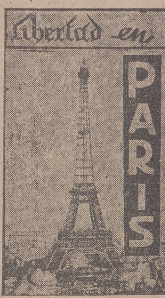
Paris. — Hace cinco días que he llegado a la capital francesa...

Un universitario vallisoletano en el campo internacional de Poitiers