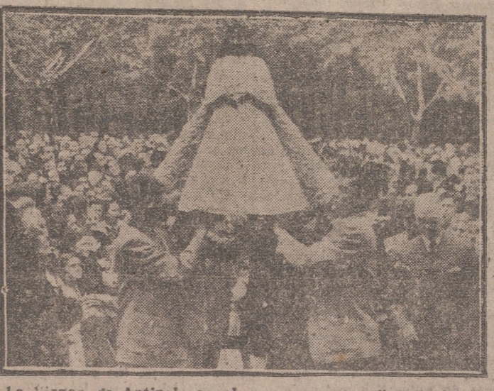
La Virgen de Antipollo en el momento de su llegada frente al Ayuntamiento

Un representante de nuestro Gobierno, altas jerarquías filipinas y nuestras primeras autoridades dieron realce a los solemnes actos de su recibimiento