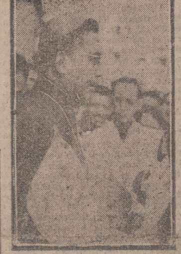
S. E. Mons. Vicente P. Reyes pronunciando su discurso de salutación en la Plaza Mayor.

A las dos en punto de la tarde del pasado domingo hizo su aparición en el amplio Paseo de Filipinos, frente a la Iglesia de los Padres Agustinos, la caravana filipina que portaba la sagrada imagen de la Virgen de Antipollo, preñada de fe y mensaje de amor de aquellas islas a España y al Santuario Nacional de la Gran Promesa. Recibieron a la imagen y a la cariñosa