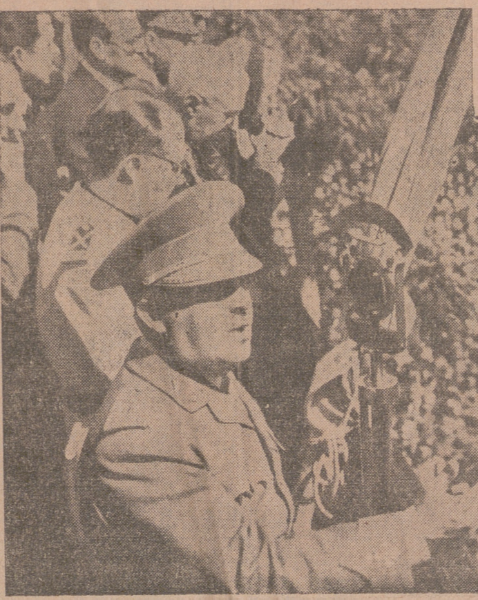
S. E. el Jefe del Estado, Generalísimo Franco, correspondiente desde el balcón del Ayuntamiento a las aclamaciones de la multitud, que no deja de vitorearle.