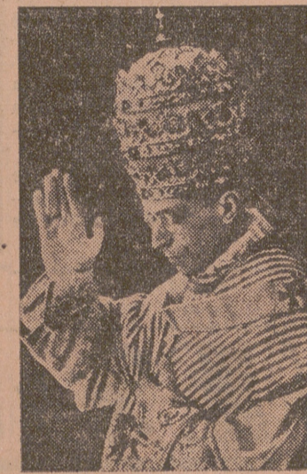
S. S. PIO XII

“ Reusa la gran responsabilidad de los especuladores que explotan la miseria del prójimo ”