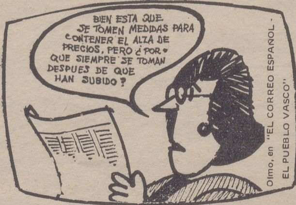
Olmo, en "EL CORREO ESPAÑOL" EL PUEBLO VASCO

Ginés Vivancos, en "EL NOTICIERO UNIVERSAL"