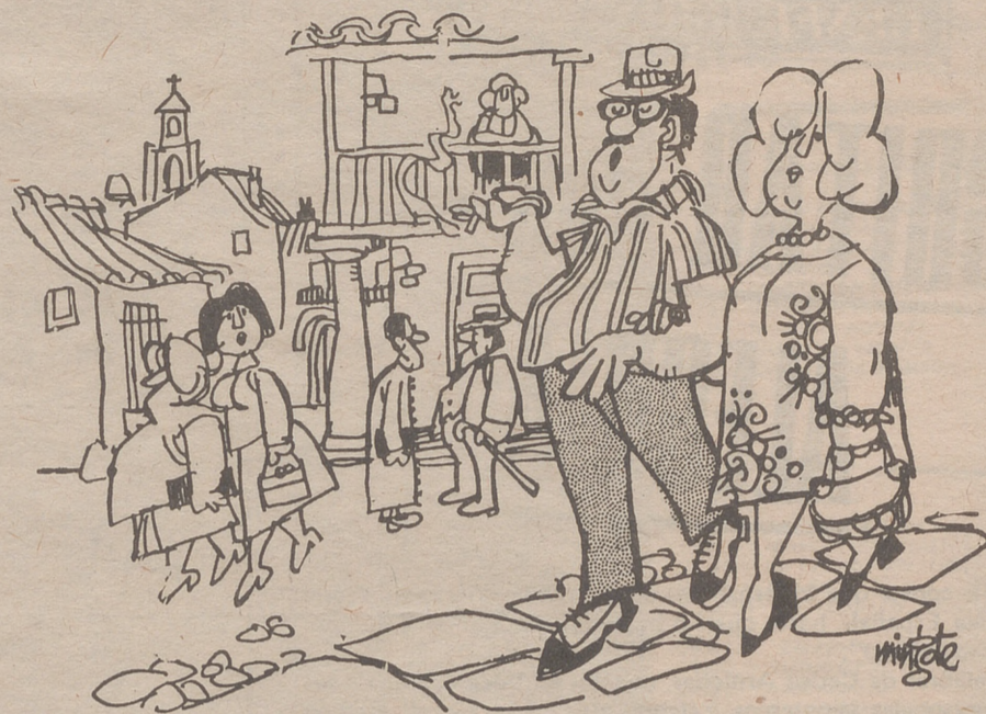
—Aquí, en provincias, son muy ignorantes. Nosotros, en cambio, si hubiéramos querido habríamos podido ver «El círculo de tiza caucásico».

sa prefiere el diálogo civilizado, pero es que llega el momento en que se actúa por terror físico, digamos, por brigadillas. Yo siempre he sido partidario de que el orden dentro de la Universidad lo guarden los estudiantes y no las fuerzas del orden público ni, como decía Ortega y Gasset, esa especie de legión azul de los bedeles. Es absurdo confiar en un bedel el orden público o la protección de un catedrático. Los estudiantes responsables son los que han de entender que la interrupción de actividades, el boicot de las elecciones libres, la propuesta de quemar la biblioteca son salvajadas que no llevan a la libertad. Entonces, quizá, si se hace un nuevo llamamiento a la responsabilidad y a la conciencia de todos los estudiantes, se consigan unas asociaciones que luego, desde dentro, se podrán modificar. Por el escarmiento de tiempos atrás y el hecho de la coacción física, hace que unas minorías a las que yo he llamado grupúsculos, porque lo son de verdad, hagan imposible la convivencia y el diálogo."