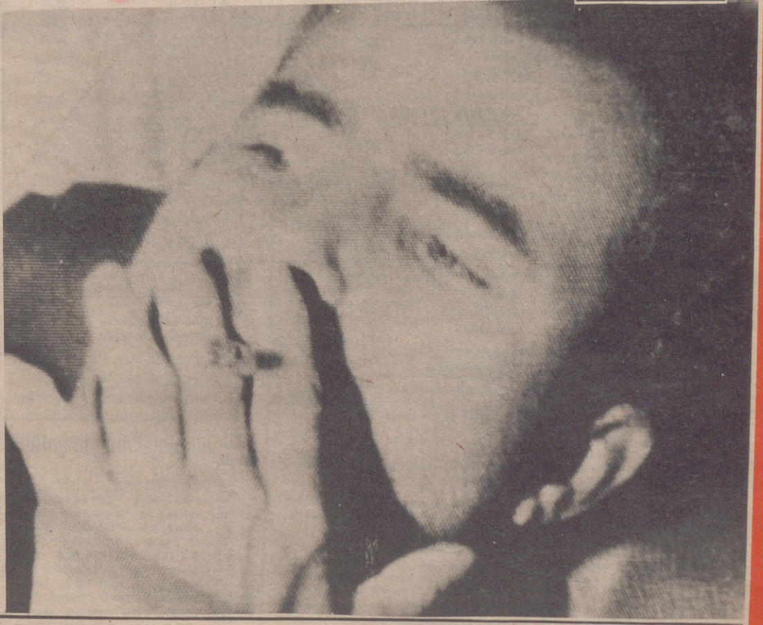
Uno de los pilotos norteamericanos - John McCain - derribados en su avión sobre Hanoy y hechos prisioneros por los norvietnamitas. - (Foto Eje).