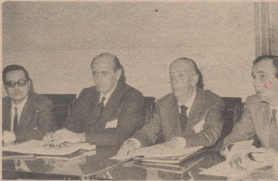
Presidencias de la I y V Ponencias del C. E. S. I. E.