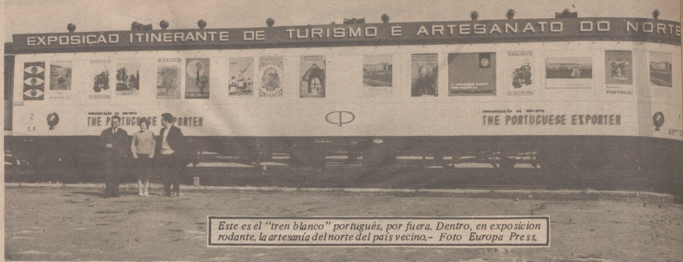
Este es el "tren blanco" portugués, por fuera. Dentro, en exposición rodante, la artesanía del norte del país vecino.