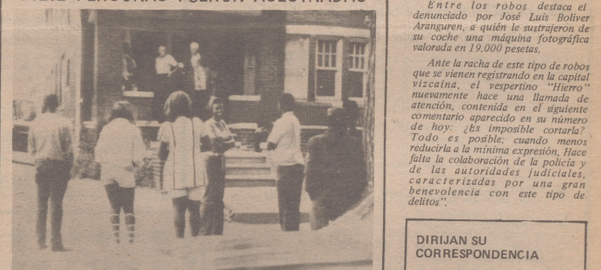
DETROIT.— Siete personas fueron encontradas muertas en esta casa en el lado oeste de Detroit. Una octava persona fue encontrada gravemente herida. La policía piensa que fue una ejecución-tipo en un "antro de morfinómanos". Se encontró en la casa una docena de armas de mano y rifles.

DIRIJAN SU CORRESPONDENCIA a "ARAGON/exprés" AL APARTADO, 39 ZARAGOZA