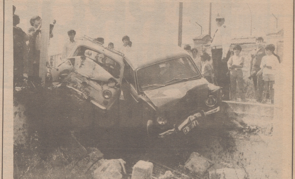
CADIZ.— Pese a lo aparatoso del choque y al extraño modo en que quedaron dispuestos los dos vehículos, no hubo que lamentar más que heridos leves. El accidente ocurrió en Cádiz.