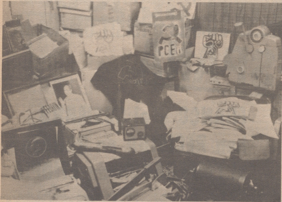
BARCELONA.— La policía barcelonesa, después de un laborioso servicio de vigilancia ha logrado la detención de diversas personas y captura de propaganda y material subversivo del partido comunista español (Internacional).