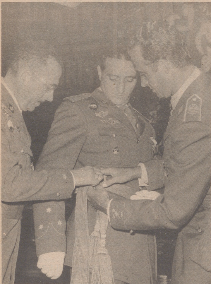
MADRID.— El Príncipe de España, don Juan Carlos de Borbón impone la faja al número 1 de la promoción de 1967 de la Escuela Superior del Ejército, capitán don Luis García-Mauriño Martínez. El acto tuvo lugar en la Escuela Superior del Ejército, en Madrid, durante la imposición de fajitas a toda la promoción.