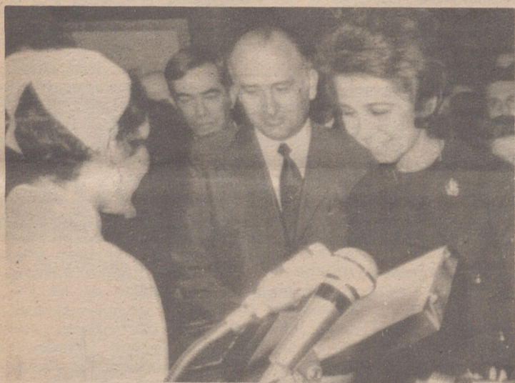
VALENCIA.— La princesa Sofía de España recibe una placa conmemorativa de su visita a la Escuela de Enfermeras de la Ciudad Sanitaria "La Fe", en Valencia.