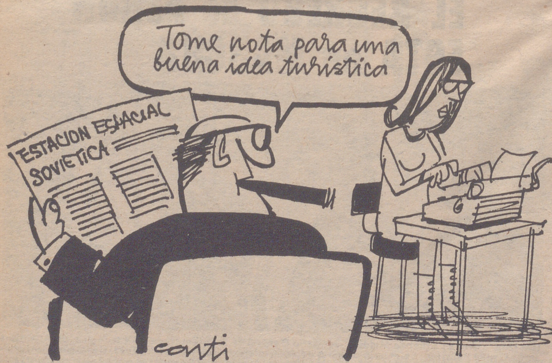
Conti, en "LA PRENSA"