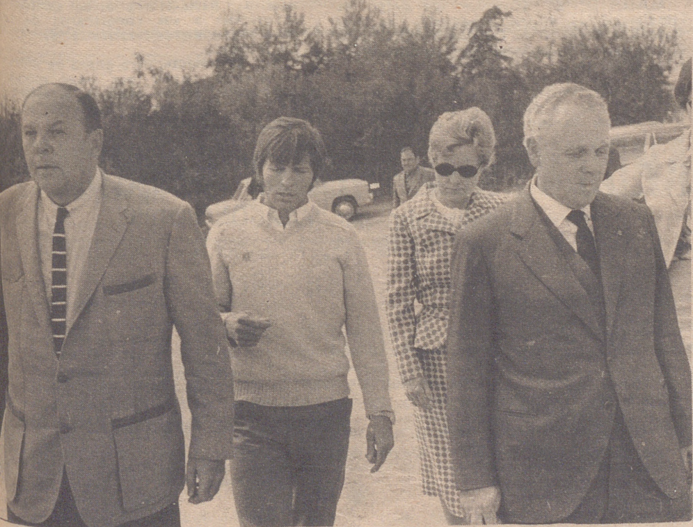
BOBA.— En la finca de El Cordobés se ha celebrado una fiesta a la que han asistido el embajador de los Estados Unidos en España, señor Hill y los asesores personales del presidente Nixon, señores Donald Rumsfeld y Robert... (Foto Europa Press).