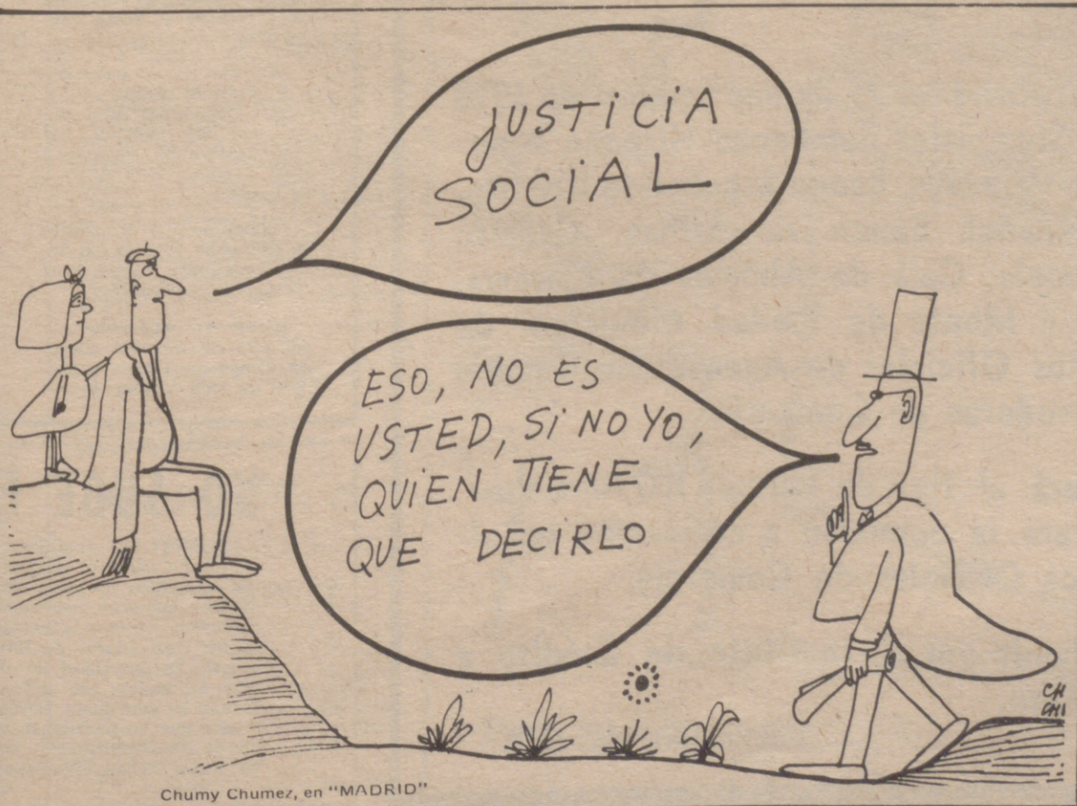
Chumy Chuméz, en "MADRID"