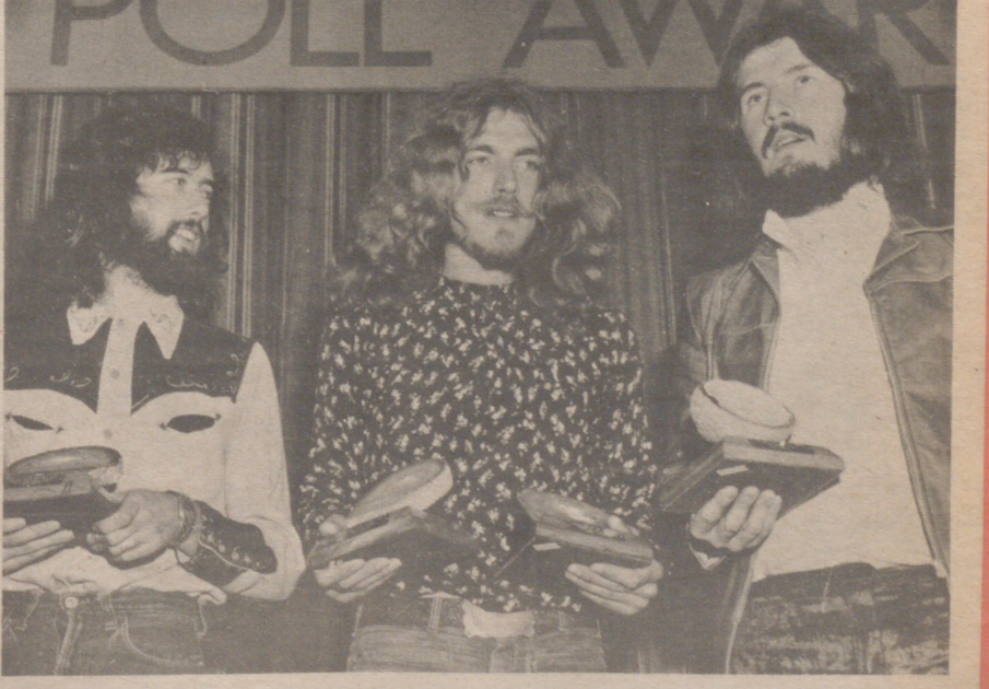
LONDRES.— Elegidos como el mejor grupo "Pop" en el Concurso 1970, miembros del grupo "Led Zeppelin", posan con sus trofeos. De izda a derecha Jimmy Page, Robert Plant (que fue proclamado además "el mejor cantante de Gran Bretaña") y John Bonham. Por primera vez en ocho años los Beatles han sido superados en el concurso.