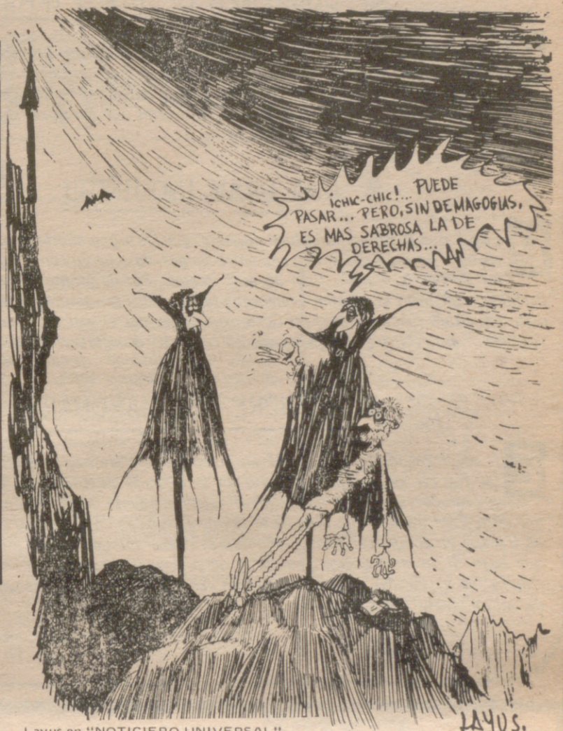
Layus en "NOTICIERO UNIVERSAL"