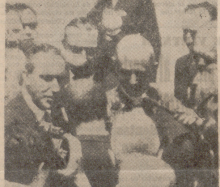
ESMIRNA.—El Papa Pablo VI habla con los periodistas, poco después de su llegada aquí, por vía aérea, procedente de Estambul.