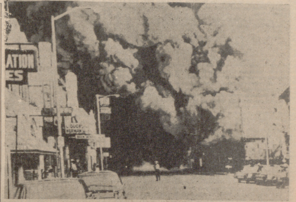
DETROIT (Michigan).—Las llamas y el humo se elevan sobre las calles de la ciudad; concretamente sobre la calle Doce, que vemos en la fotografía, durante el tercer día de violencias raciales

MUNICH, 27. (PYRESA).—Por fin se ha pensado también un poco en aliviar el duro trabajo del periodista. El "Europa Club" ha ideado una nueva escritura para tomar apuntes. La idea germinó pensando en favorecer a los periodistas, estudiantes y colegiales que se ven obligados a tomar no sólo apuntes, sino a tomarlos a grandes velocidades, corriendo el peligro, especialmente en las conferencias de Prensa, de anotar lo secundario escapándose a uno lo primordial. Cierto que se dispone ya de la taquigrafía, pero uno no sabe si por presunción o en gesto de sinceridad, las señoritas que la dominan la presentan tan difícil que muchas veces se duda entre aprender taquigrafía o empezar una prueba de la rapidez con que puede el interesado adiestrarse en el nuevo sistema de una escuela de Baviera: al cabo de las nueve primeras lecciones los alumnos podían escribir sin vacilar cien sílabas. De todas formas, los taquígrafos y taquígrafas no deben temer la competencia. El nuevo sistema no podrá desplazarla jamás, ya que es mucho más simplificado.