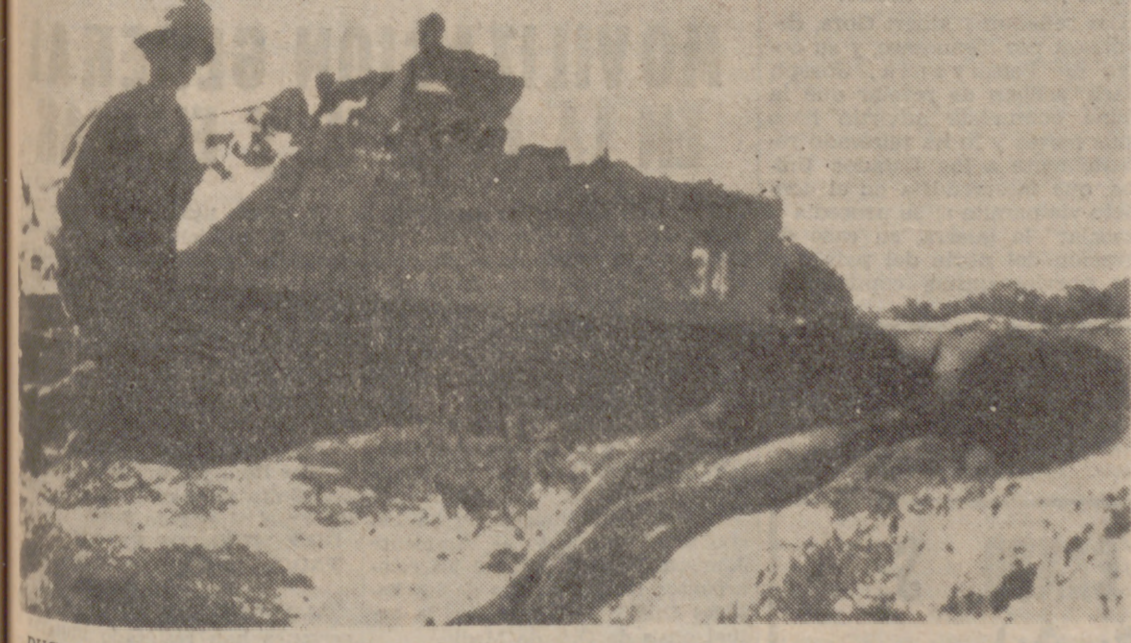
DUC PHO (Vietnam del Sur).—A través de una plantación de caña de azúcar, durante la "Operación Baker", tropas americanas ante los cadáveres de miembros del Vietcong.