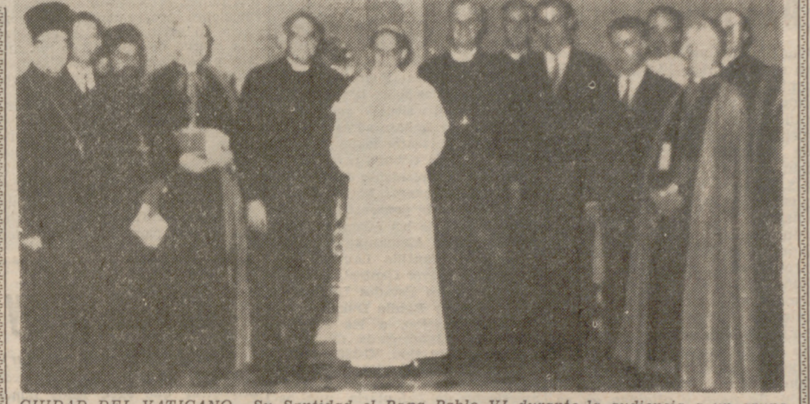
CIUDAD DEL VATICANO.—Su Santidad el Papa Pablo VI durante la audiencia a un grupo de trabajadores de la Iglesia Católica y del Consejo Mundial de Iglesias.

DICEN QUE BROTA SUDOR DEL ROSTRO DE UN CRISTO, EN VENEZUELA