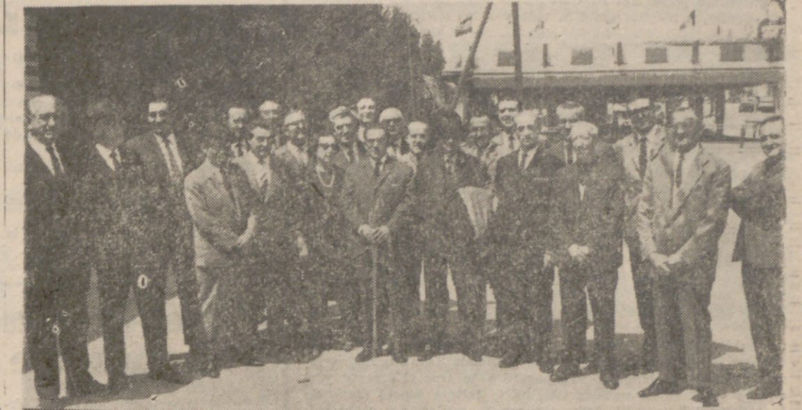
Los jubilados y los funcionarios que han cumplido sus bodas de plata.

Finalizaron los actos con una representación, a cargo de los alumnos de esta Escuela Mayor de Mandos "José Antonio", del "Peregrino a la Reina Isabel", de Diego Gul-