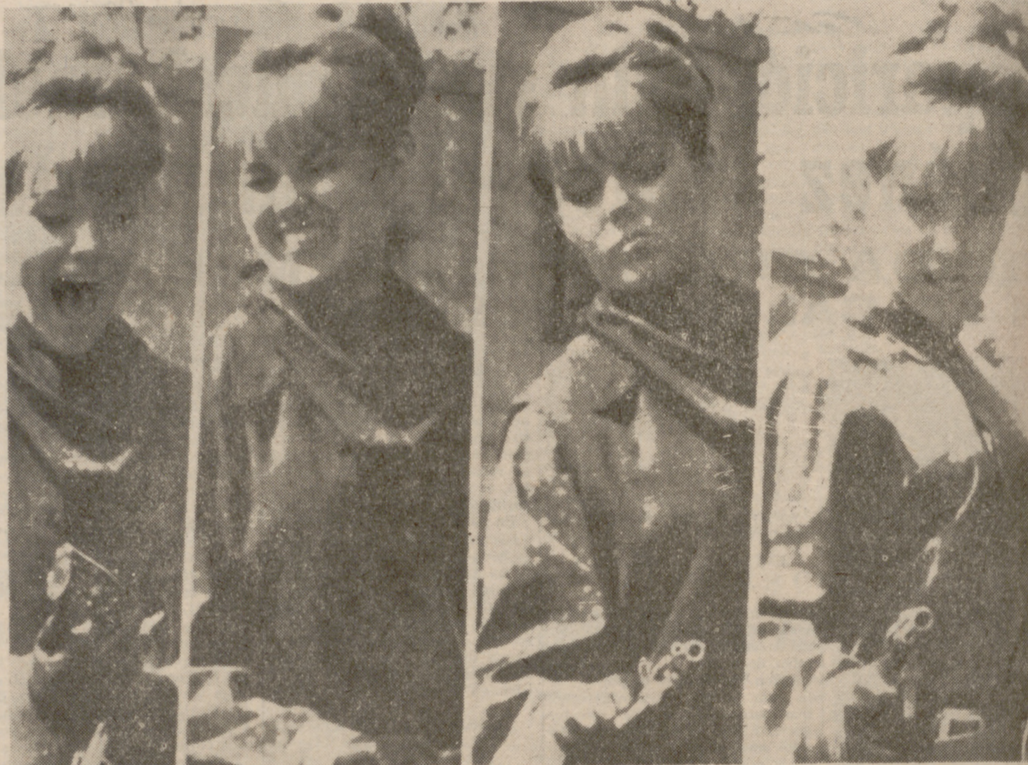
HOLLYWOOD.—La actriz Bárbara Rhoades parece tener problemas al manejar el arma que debe usar en el rodaje de la película "The Shakiest Gun in the West".