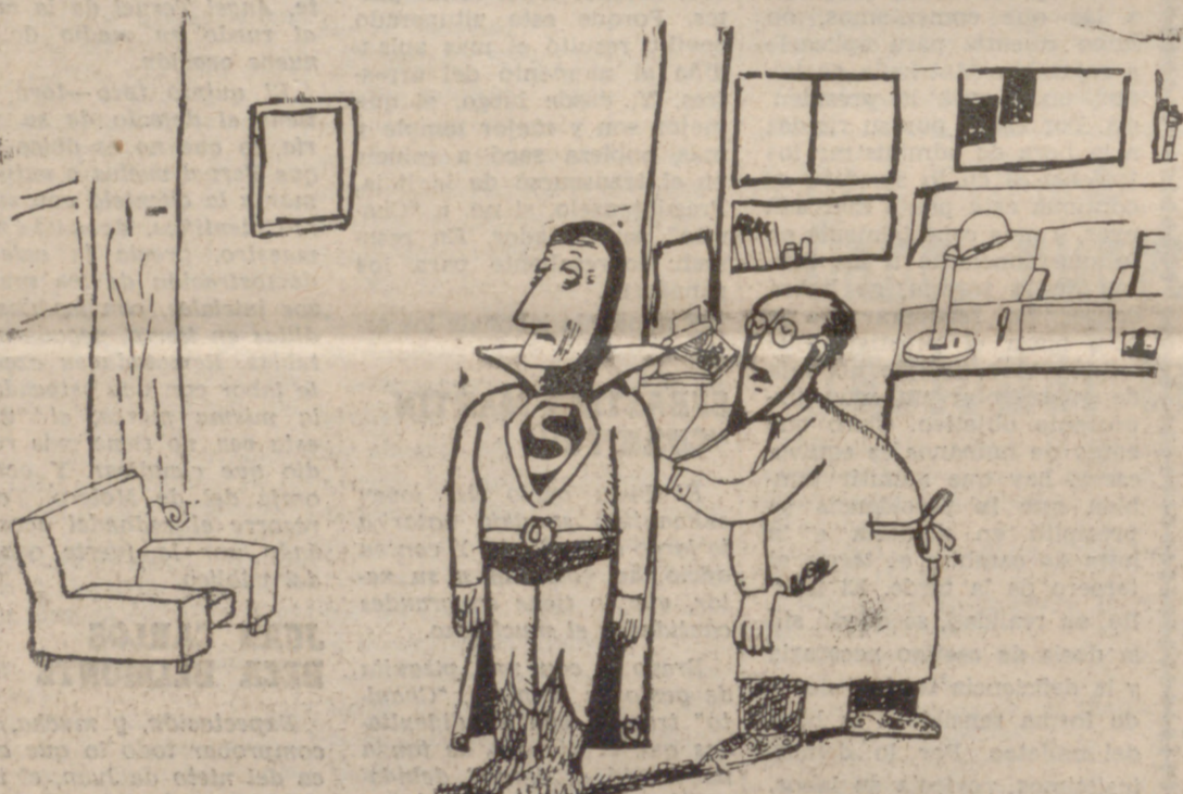
—Cuando subo una escalera, siento una enorme fatiga, palpitaciones y mareos...