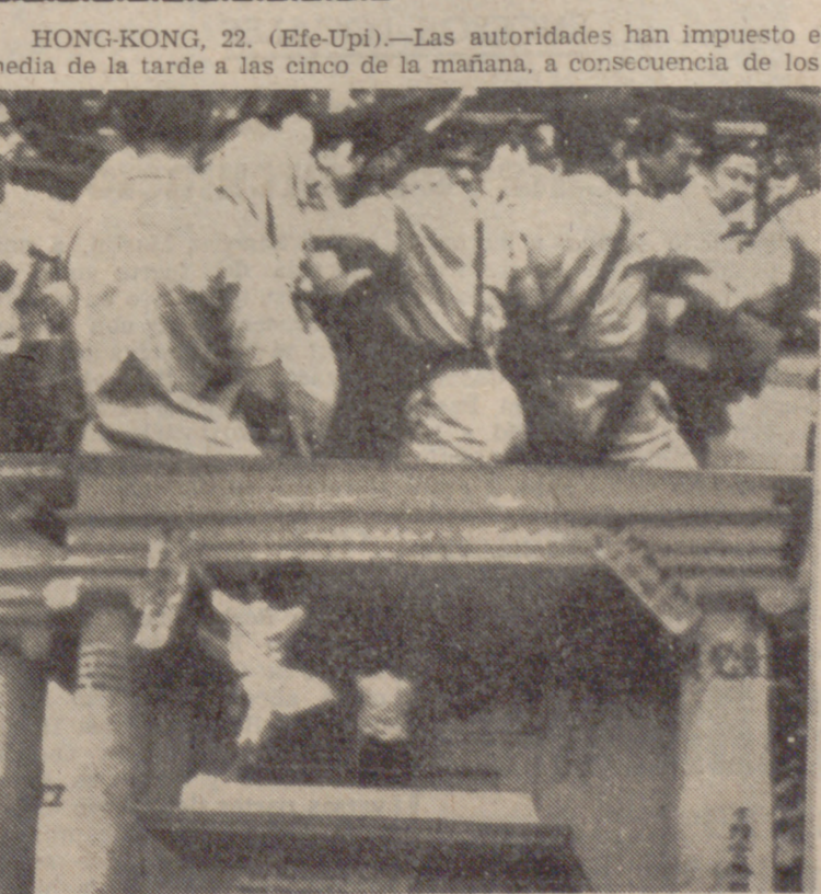
HONG-KONG.—En la fotografía superior vemos a la Policía formando una barrera humana para detener a los jóvenes manifestantes que quieren entrar como sea en la residencia del gobernador, sir D. Trench. Abajo, los manifestantes escriben en la residencia del gobernador, en caracteres chinos y en idioma inglés.—(Telefoto Upi-Cifra).

HONG-KONG, 22. (Efe-Upi).—Las autoridades han impuesto el toque de queda desde las seis y media de la tarde a las cinco de la mañana, a consecuencia de los disturbios registrados en el centro de la ciudad y propagados a otros sectores de la misma.