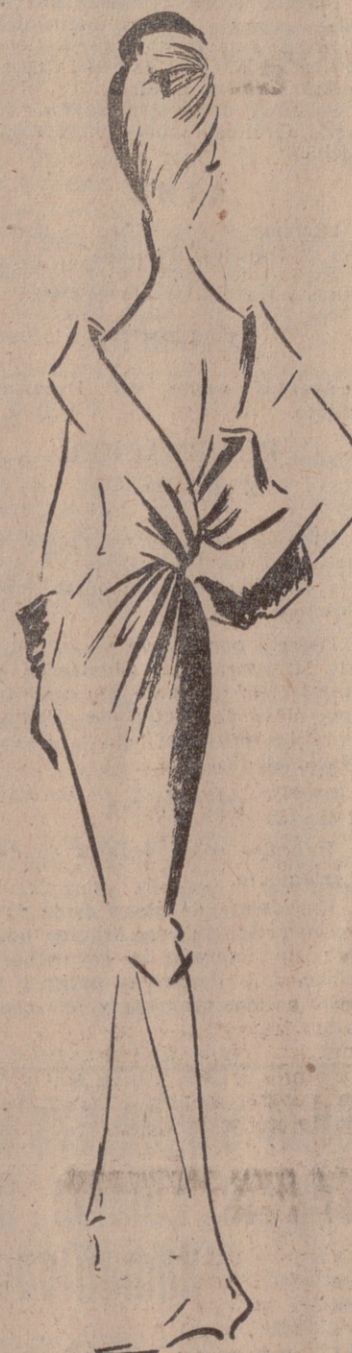
Traje cocktail en brocado negro.

Para las noches de gala hay dos tendencias: el largo vestido tubular y la falda ancha y suntuosa, abundan los profusamente bordados, nuevos escotes redondos descubren ampliamente la espalda, echarpes que nacen del complicado corte de la falda, profusión de lamés, encajes vaporosos o rebordados, satén duquesa, faya y brocados, todos ellos enriquecen y dan suntuosidad a mi colección.