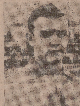
La Junta de Concesión del Trofeo "Mejor Deportista Juvenil del año 1960", para la provincia de Valladolid...