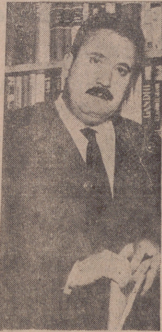
Tomás Salvador, ganador del premio literario Planeta 1960 con su novela "El atentado", fotografiado después de su triunfo en su cuarto de trabajo.

Tomás Salvador, ganador del "Planeta", concurrió al Concurso por necesidad económica Cree que los premios han despertado a la literatura española de su letargo HA PUBLICADO QUINCE NOVELAS, Y EN ESTA «SE HA QUEDADO EN EL PURO ESQUELETO»