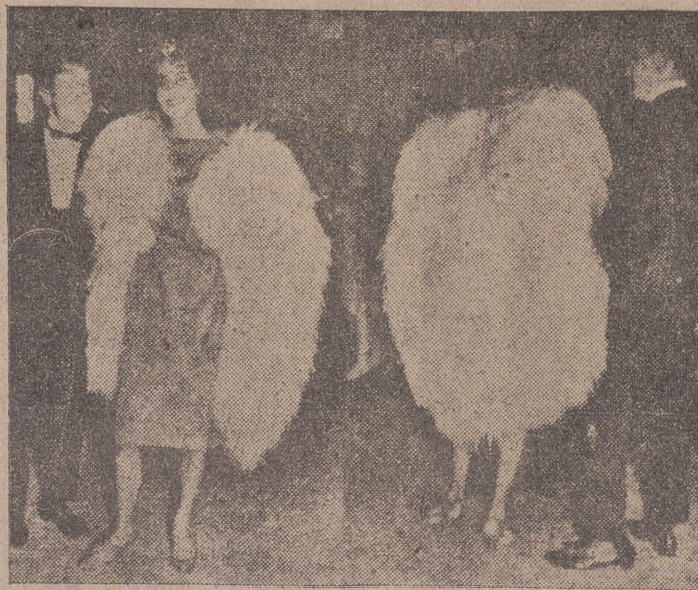
Fantasia y más fantasia compone el mundo de la moda de las pieles. No existe un ningún animal que no haya servido para confeccionar alguna prenda. Ahora es la cabra de Alaska la que da estos bellos modelos exhibidos en las fotografías.