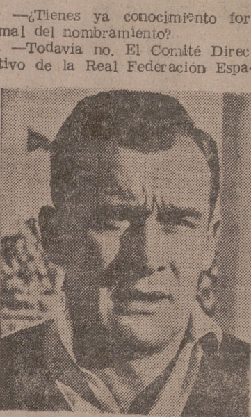
¿Tienes ya conocimiento formal del nombramiento?

—La verdad, sí. Contento y muy satisfecho.