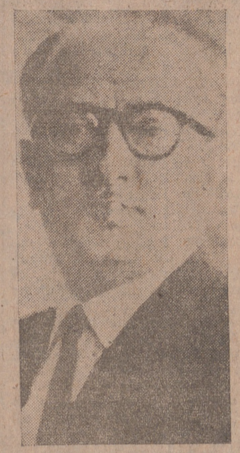
Guy Mollet, jefe socialista, gana puntos. Volverá al Gobierno, del que ya fue vicepresidente con el primer Gobierno de De Gaulle.

El y Massu fueron los iniciadores de la creación de la V República francesa. Se espera la vuelta al Gobierno de Guy Mollet. Este nombramiento sería una maniobra a la izquierda de De Gaulle.