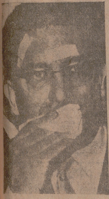
Soustelle, fotografiado el día que tuvo el atentado.

El y Massu fueron los iniciadores de la creación de la V República francesa. Se espera la vuelta al Gobierno de Guy Mollet. Este nombramiento sería una maniobra a la izquierda de De Gaulle.