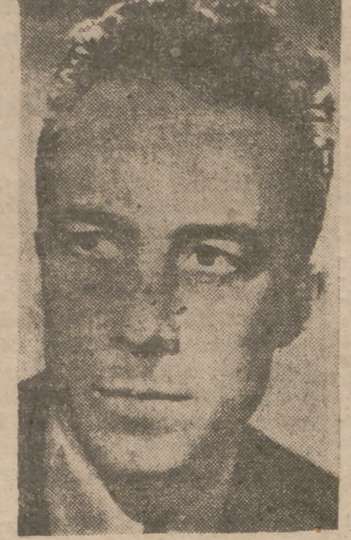
do un hombre satisfecho. Gracias a ella, he conquistado la divina clarividencia del solitario (Se exalta cada vez más, estragando poco a poco a Cesonia, quien se entrega sin resistencia, con las manos un poco tenidas hacia adelante. El le habla, incinado, al oído.) Vivo, malo, ejerzo el poder delirante del destructor, comparado con el cual el del creador parece una parodia. Eso es ser feliz. Esa es la felicidad: esta insuperable liberación, este universal desprecio, la sangre, el odio a mi alrededor, este aislamiento sin igual del hombre que tiene toda su vida bajo la mirada, la alegría desmedida del asesino impune, esta lógica impenable que tritura vicisitudes humanas (Bie., que tritura, Cesonia, para lograr por fin la soledad eterna, que desea).

Publicamos el impresionante final de "Calígula", el drama de Albert Camus (Premio Nobel, muerto en accidente) que fue estrenado en París en 1944: CESONIA (con asanto). — ¿Acaso es la felicidad esa libertad espontánea? CALIGULA (apretando poco a poco con el brazo la garganta de Cesonia). — Tengo por seguro, Cesonia. Sin ella hubiera si-