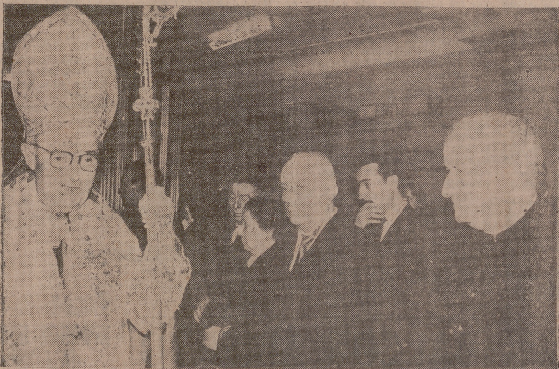
UN MOMENTO DE LA BENDICION POR EL EXCMO. SR. ARZOBISPO

INAUGURO AYER SU ESTABLECIMIENTO DE QUEIPO DE LLANO, NUM. 4