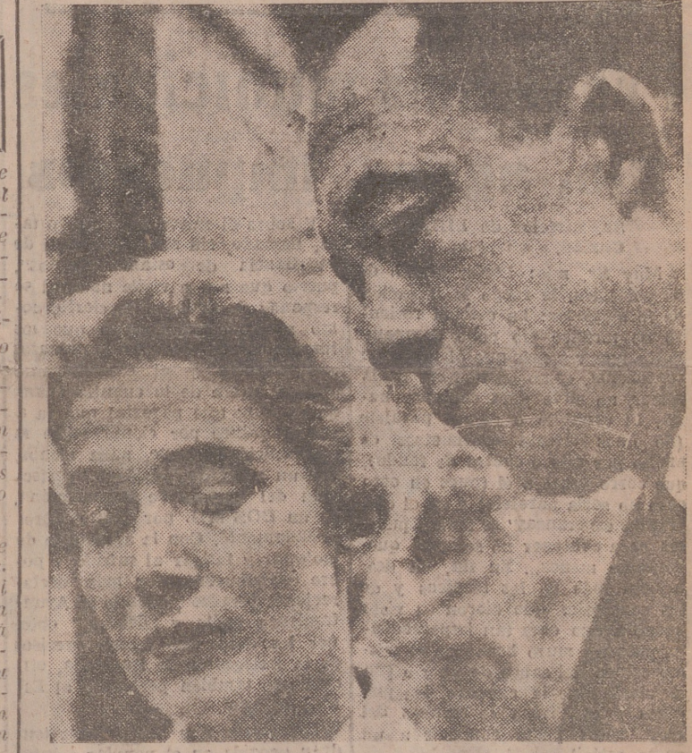
CAMUS, CON SU ESPOSA (En última página, amplia información)