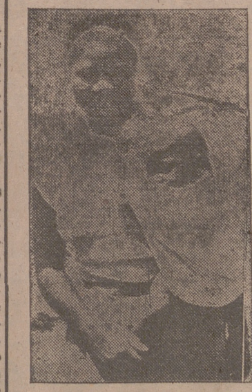
Los batangas son el porvenir de la Prefectura, el futuro de la Iglesia, la Iglesia misma de Wankie.

Africa. Un continente en explosión. Explosión demográfica. Explosión económica. Explosión política. Explosión cultural. Explosión social. Explosión de muchas miradas. África es el futuro de Europa. Y Francia y Estados Unidos y Egipto y la Gran Bretaña. Unos de una forma y otros de otra. Cada cual con sus propios ojos. La Iglesia también mira hacia África. A su modo. Su modo es el mismo con que Dios mira del cielo a la tierra. Porque también el Señor mira hacia África. Claro que la mirada de Dios es limpiísima, inmaculada, santa, bienhechora, redentora. Dios y su Iglesia miran al continente como la madre que mira a su hijo sufriendo. Aún más. Porque