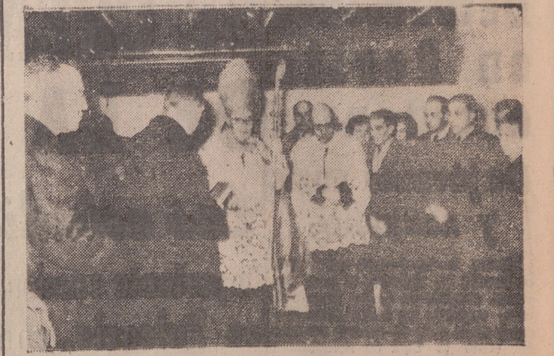
El Prelado, bendiciendo el nuevo establecimiento.