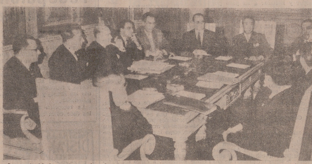
Las autoridades y jerarquías, durante la importante reunión. Entre ellas, figuran nuestro Jefe Provincial y Gobernador Civil y el Delegado Provincial de Sindicatos.

Importante reunión, en Palencia, con asistencia de cuatro gobernadores civiles También estuvieron presentes el Director General de Obras Hidráulicas y el Vicesecretario Nacional de Ordenación Social