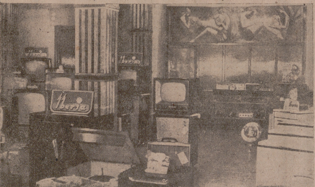
TELEVISION Y ALTA FIDELIDAD