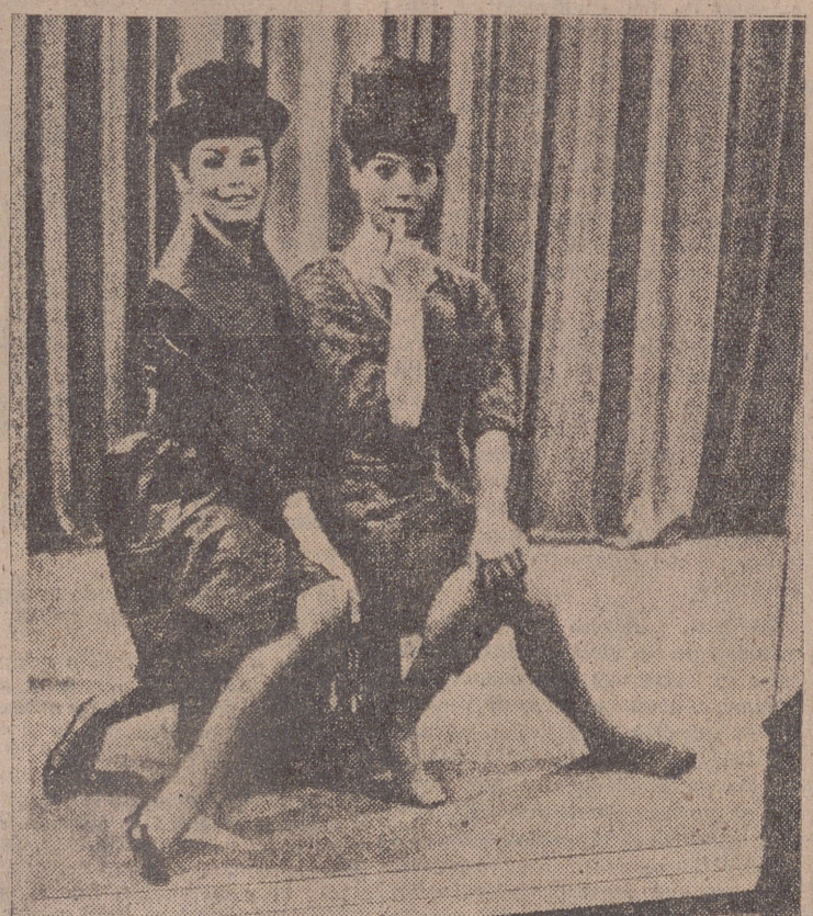
Anita Stroyberg y Elsa Martinelli, en un curioso plano mientras prueban los extraños sombreritos de cilindro. Se hallan rodando un film bajo la dirección de Roger Vadim, en el que trabajan también Mel Ferrer y Paolo Stoppa.