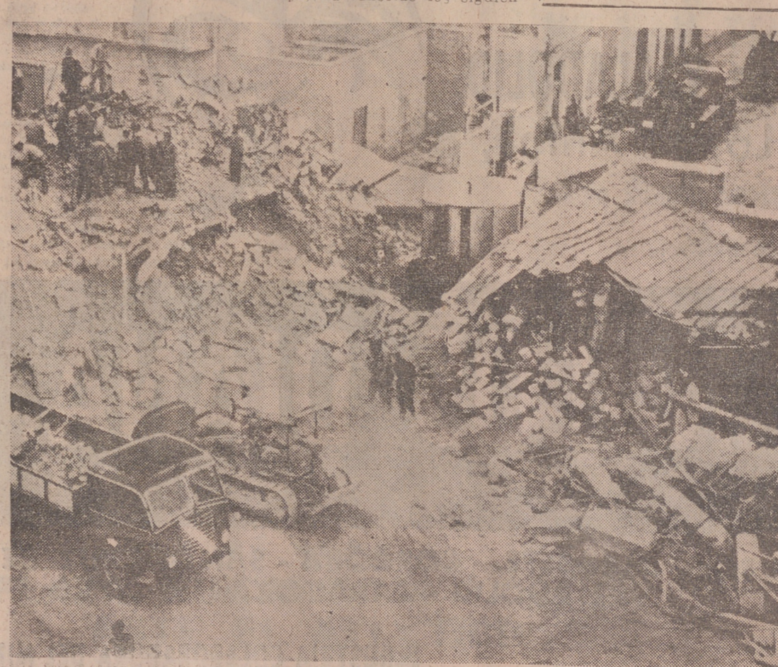
Este era el aspecto que ofrecía el lugar después de haberse derrumbado el edificio en Barletta.