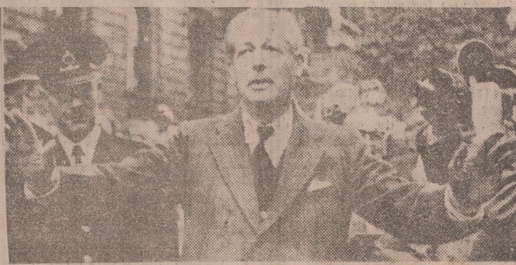
EL TRIUNFADOR: MACMILLAN Londres, 9. — Los resultados completos de los 630 escaños en pugna de la Cámara de los Comunes no serán conocidos hasta última hora de esta tarde.

Bagdad, 9. — El general Karim Kassem, en "excelente estado" después de haber sido curadas las tres heridas de bala que sufrió hace dos días en el atentado de que fue objeto, será dado de alta en el hospital donde se encuentra hoy mismo. Mohammed Mehdi Jawaheri, un poeta iraquí, ha dicho que vio ayer el coche en que iba el primer ministro cuando fue atacado, al ir a visitar a Kassem al hospital, y que el automóvil tiene los impactos de 43 balazos, añadiendo que el conductor del mismo fue muerto instantáneamente.—Efe.