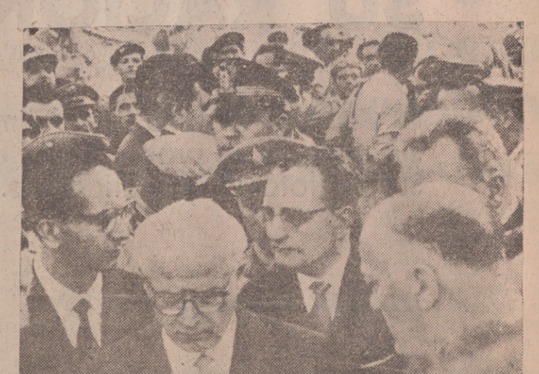
En el lugar de la tragedia, el presidente Gronchi, que prometió que haría ejemplar justicia. Con él, el Ministro de Justicia y otras autoridades.

Solamente en lo que llevamos de año, Italia, a partir del 2 de mayo, ha conocido los siguientes