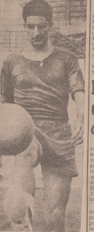
Pero el toque de la pelota, con el pie, fue su principal objetivo. Ramiro, gran distribuidor de juego, por su posición en el campo, practicó constantemente el dominar el balón antes de pasar al compañero.

Vavá. El fichaje del máximo goleador del Campeonato del Mundo fue la auténtica "bomba" de la temporada anterior. Los dirigentes atléticos no vacilaron ante el gran desembolso que suponía, ansiosos de reforzar el cuadro ante la Copa de Europa. El carloca, en su segunda temporada en España, sigue sin acordarse en España, sigue sin acordarse en España, sigue sin acordarse en España.