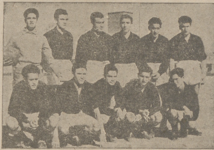
Equipo del Circular C. F., que ayer sucumbió por el fuerte tanteo de cinco-cero frente al C. D. FASA.