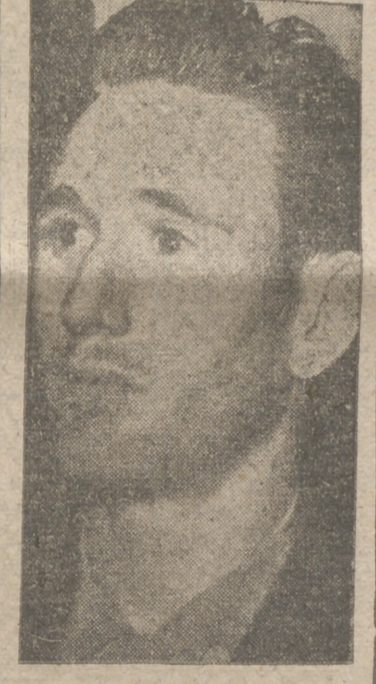
formó parte de la expedición. Tampoco existe razón atendible que justifique la presencia de Pimilla en Zaragoza si no había de actuar...

El «trainer» del Manchester United, Matt Busby, entrenador también de la selección nacional inglesa ha escrito un artículo revolucionario para acomodar el fútbol al sentido común, algo que no le ha cabido nunca en la cabeza a la International Board, en los últimos tiempos. Fide Busby la abolición del salario máximo para los «pros», porque cobran muy poco: el que más, veinte libras semanales. Y, también, que en los traspaños el jugador perciba un porcentaje en consonancia con la cantidad motivo de «negocio» y no las diez libras de siempre. Y añade Busby: «Hay que suprimir la carga al guardameta y protegerle de la brutalidad y eludir accidentes graves. Finalmente, quiere que la F.I.F.A. se defina sobre la sustitución de un jugador en cualquier instante del partido, en cuanto exista una causa que lo justifique; pero, a fin de evitar una ficción, el sustituto no podrá salir al campo hasta tanto no trascorra un cuarto de hora de la ausencia del anterior. Quiero decir esto que en los últimos quince minutos no cabrían sustituciones».