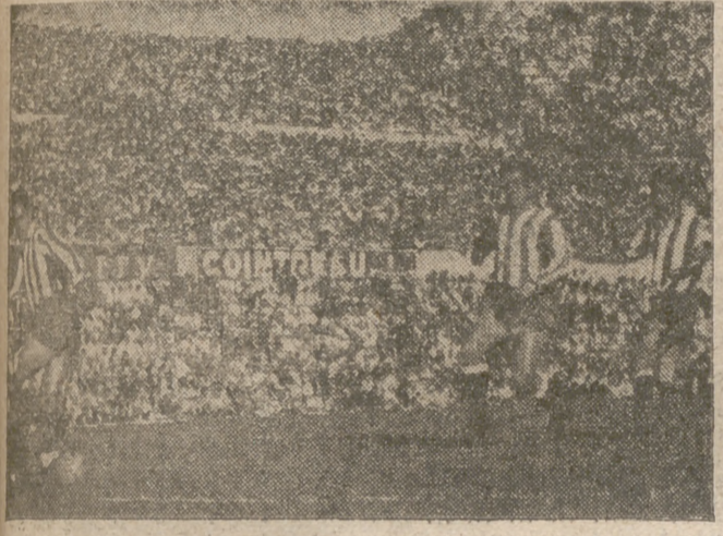
Alto se le escapa la pelota de las manos y el Español consigue su segundo tanto.

El desastre de La Romareda no tiene precedentes La indiferencia vallisoletana permitió la victoria del Zaragoza