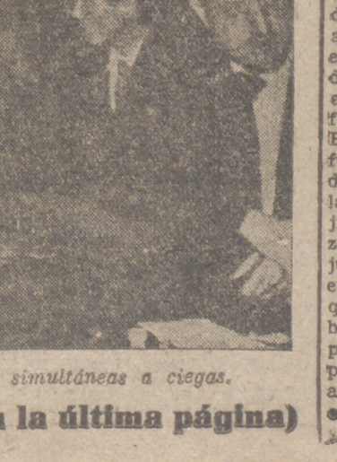
Momento de comenzar las simultáneas a ciegas. (Información en la última página)