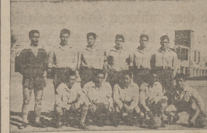
El C. D. FASA, que con su victoria de ayer se ha erigido en nuevo líder, puesto que espera retener al final del Campeonato, revalidando así el título que consiguiera la temporada anterior.

A la vista de los partidos celebrados por ambos conjuntos en jornadas anteriores y sus resultados, no nos podíamos figurar que este encuentro terminara de esta forma. Pero hay que rectificar nuestros juicios anteriores. Pues si bien el Betis nos pareció el conjunto más fuerte y más en juego, hoy nos ha defraudado. Sus jugadores se empeñaron hasta la saciedad en jugar un fútbol a base de pascitos, con lo que tardaban horrores para llegar al área con traría, dando lugar a medios y defensas a cubrir huecos y coquearse en condiciones óptimas de haberse con la pelota. Desperdiciaron muchas jugadas por atracarse de balón, que no soltaban más que en última instancia. No nos gustó ayer el Betis; se notó mucho la falta de Olmedo como ordenador de juego. Pero de todas formas no creemos que la ausencia de un jugador pese tanto en el conjunto, que no hilvanó más que escasas situaciones de verdadero peligro. El caso paradójico es que juegan buen fútbol, pero hay que meterles en la cabeza QUE SIEMPRE EL BALON VA MAS DE PRISA QUE EL JUGADOR, y si ellos tardan 40 segundos en llevar la pelota al área contraria, el despeje de un defensa tarda dos en llegar a la suya. Esta lección posiblemente la sabían los del Arces, porque jugaban al contrario que el Betis: A base de pases profundos unas veces a las alas y otras al centro. Plantearon muy bien el