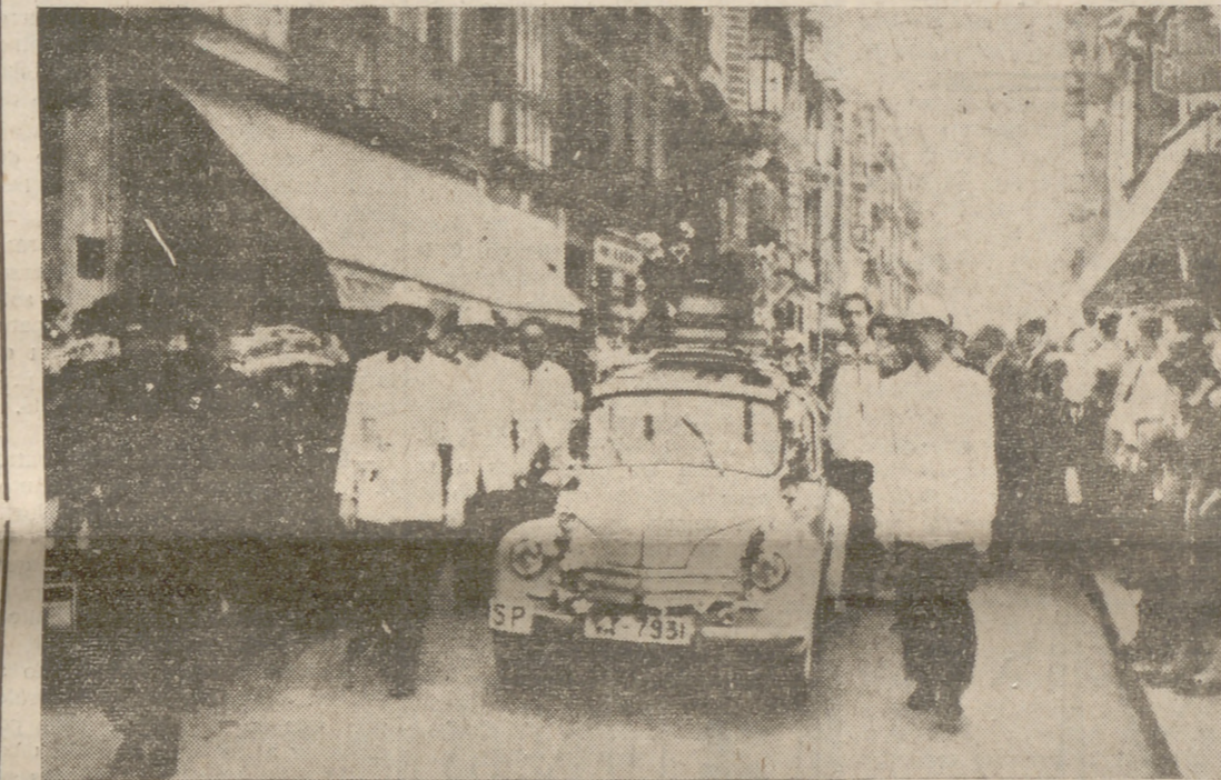
La imagen de San Cristóbal llevada en procesión escoltada por la Guardia Municipal de la Circulación.

hallaba adornada magníficamente con flores.