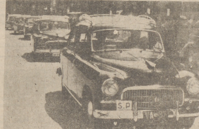
Los taxis de Valladolid, dirigiéndose a la Plaza Mayor para ser bendecidos.