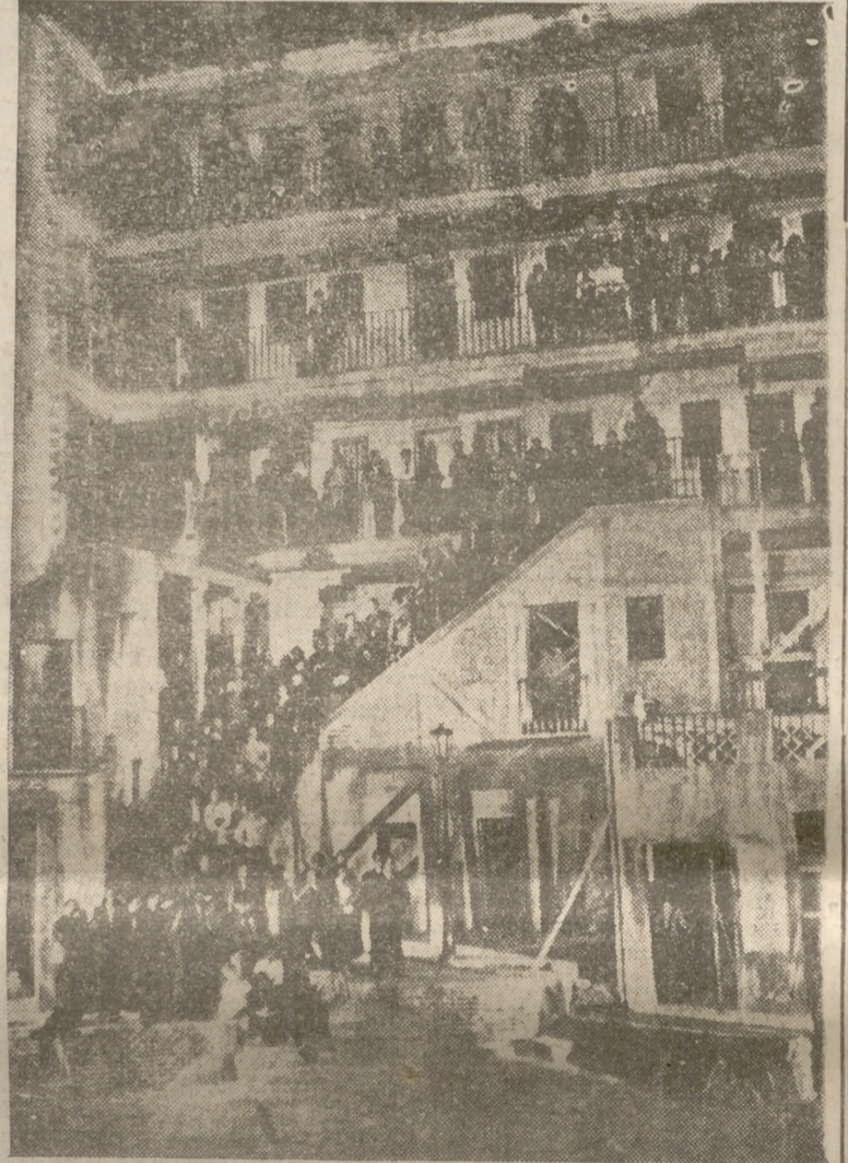
La Corrala, durante la representación de "La Revoltosa".