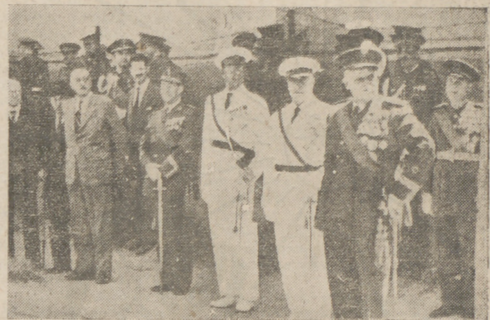
El Capitán General y demás autoridades, presenciando el desfile.

saladilla rusa, huevos a la turca, filetes de cerdo, vinos, licores, café y cigarrillos. Esta tarde, como final de los festejos, se verificarán diversos juegos y concursos, terminándose la jornada con la proyección de dos películas: "La última carga" y "El experto del volante".