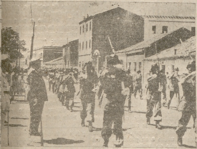
EL MARCIAL DESFILE DE LAS TROPAS