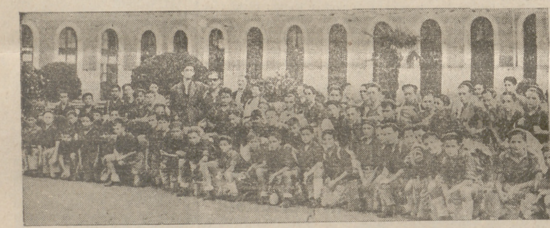
Comaradas de las Falanges Juveniles de Franco, de Valladolid y pueblos de la provincia, que han regresado ayer del Campamento "Onésimo Redondo", en Somo Loredó.