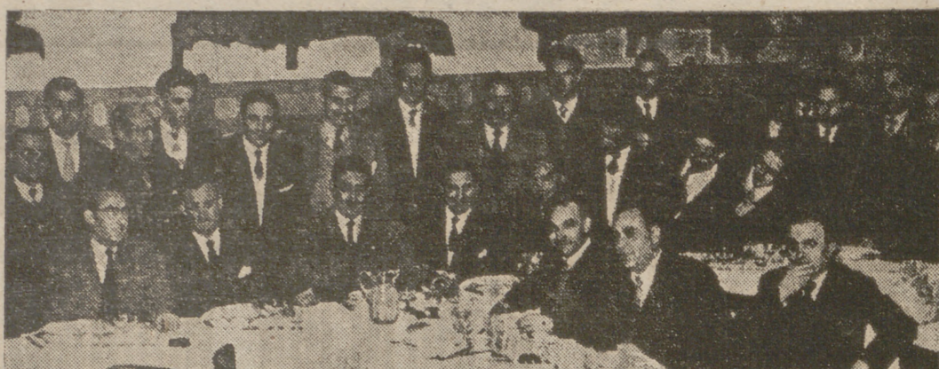
ASISTENTES AL HOMENAJE

Al hacerse cargo de la Jefatura Central de Trabajo del Frente de Juventudes