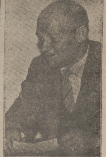
El alcalde de la Mota del Marqués.

los fines a que se ha destinado esta rifa tengan su mejor triunfo en la construcción de viviendas para quienes más las necesitan. Un saludo a todos los camaradas y mis respetos a las jerarquías de la Falange vallisoleitana.