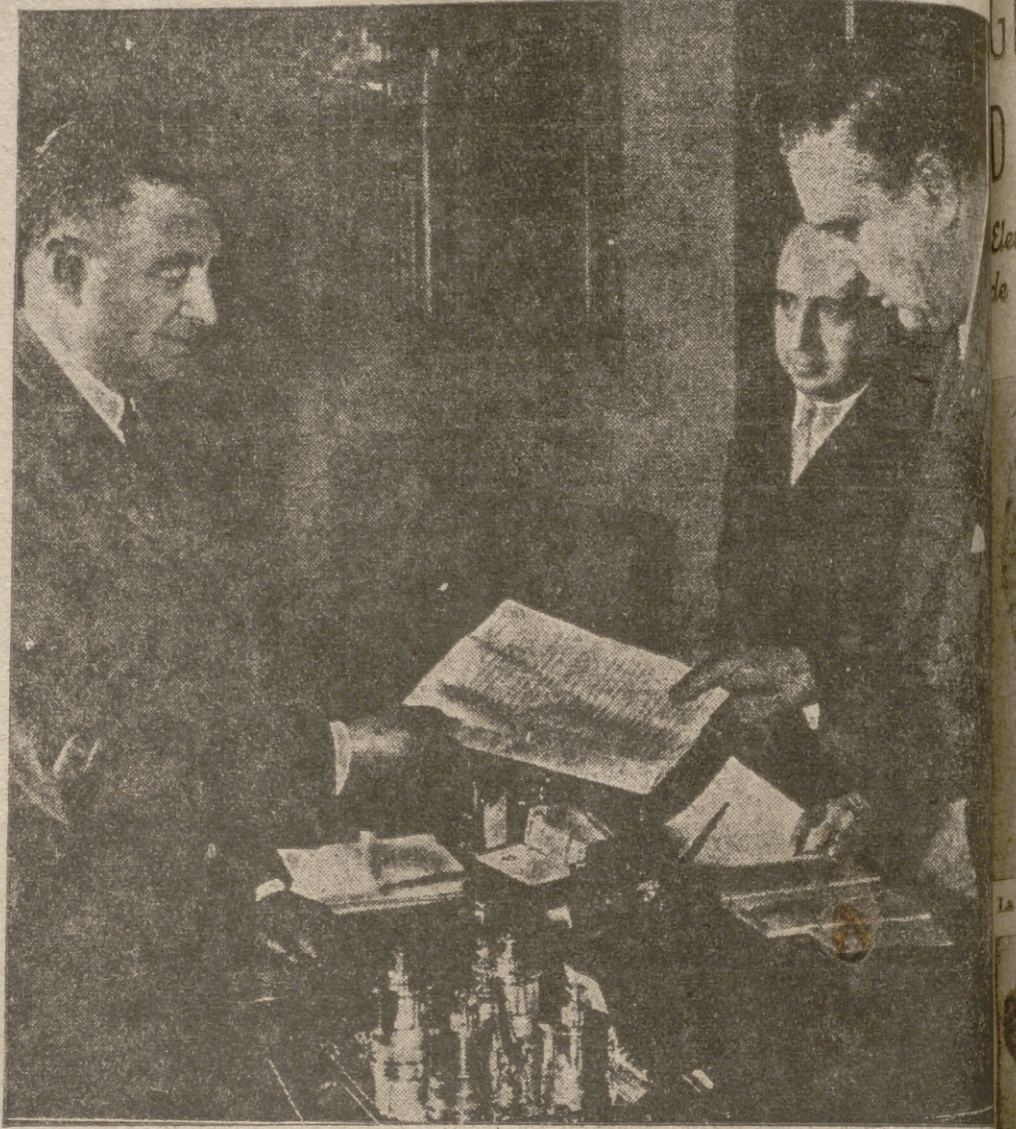
Detalle del momento de la entrega del resguardo del oro robado a España, en el Palacio de la Cruz, en presencia de nuestro ministro de Asuntos Exteriores. Todo ello ha sido llevado a cabo una secreta y rápida gestión entre el ministro de Hacienda del Frente Popular y el Gobierno español.

No hace falta ningún estudio para suponerlos dábiles pensar que si, sin embargo, existen una serie de hechos que nadie es actualmente capaz de explicar. Porque, si bien es cierto que las relaciones entre Gordon y Negrín, así como las del exministro de la República Luis Nicolau d'Olier con Julio Just, no eran cordiales en modo alguno, y además durante los últimos años, el segundo vivía apartado totalmente de sus compañeros en exilio, ¿cómo es posible que documentos de un valor tan grande, comprobantes de un enorme tesoro, se encontrasen en su poder y por toda