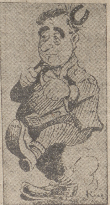
Gordon Ordax, el hombre tan acaloradamente con la cuestión del oro español.

ta, el maquinista en cuestión fué sustituido por otro de más confianza. Se reanudó la marcha. El mismo día 16 salió de Atocha el segundo tren, y así hasta siete, durante las expediciones hasta el 10 de octubre de 1936. Todo lo transportado en los siete trenes sumaban 700 toneladas de oro en moneda y barras y 1.638.650 kilogramos de plata amonedada.