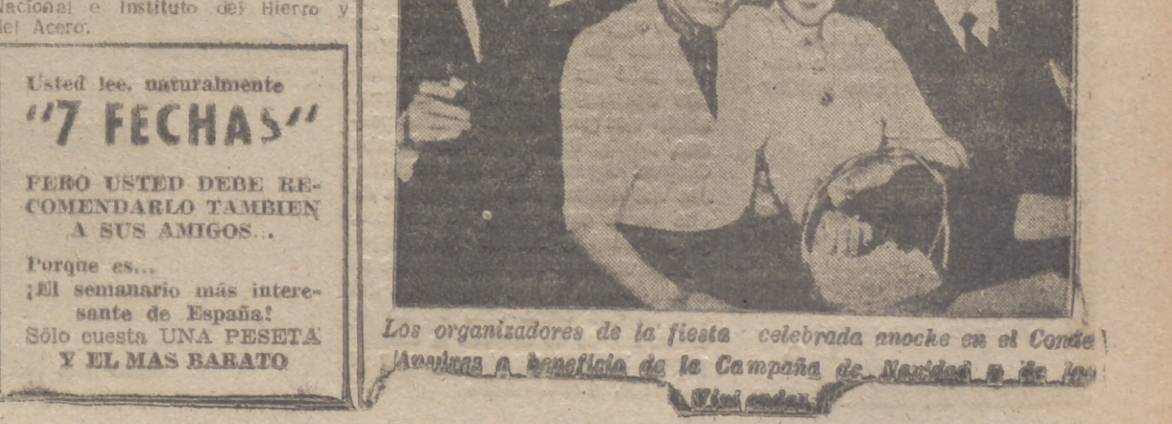
Los organizadores de la fiesta celebrada anoche en el Conde Ansúrez a beneficio de la Campaña de Navidad...