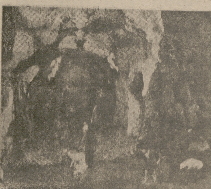
Belén presentado por el Colegio de Nuestra Señora de Lourdes, el cual ha sido galardonado con el primer premio de 1.000 pesetas, de la categoría E, en el Concurso instituido por el Frente de Juventudes.

Este año la profusión de Belenes presentados a concurso ha superado todos los pronosticos que se han hecho. Es costumbre en nuestra ciudad, a la llegada de las fiestas navideñas, la formación de conjuntos en la mayor parte de los hogares, casi siempre estructurados con piezas de índole modesta que no buscaban con su construcción más que el solaz de los pequeños componentes de cada familia. Sin embargo, este año no se ve al debido a que la tendencia "belenista" va en auge y está enriqueciéndose a sí misma, o quizá debido al señuelo que representaba el concurso organizado por el Frente de Juventudes, la cuestión es que han sido múltiples los que han alcanzado en belleza y estética, por lo que al Jurado le ha sido imposible emitir un fallo descansado.