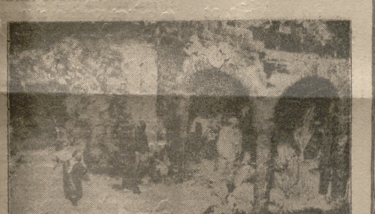
Belén presentado por el Colegio de Nuestra Señora de Lourdes, el cual ha sido galardonado con el primer premio de 1.000 pesetas, de la categoría E, en el Concurso instituido por el Frente de Juventudes.

Este año la profusión de Belenes presentados a concurso ha superado todos los pronosticos que se han hecho. Es costumbre en nuestra ciudad, a la llegada de las fiestas navideñas, la formación de conjuntos en la mayor parte de los hogares, casi siempre estructurados con piezas de índole modesta que no buscaban con su construcción más que el solaz de los pequeños componentes de cada familia. Sin embargo, este año no se ve al debido a que la tendencia "belenista" va en auge y está enriqueciéndose a sí misma, o quizá debido al señuelo que representaba el concurso organizado por el Frente de Juventudes, la cuestión es que han sido múltiples los que han alcanzado en belleza y estética, por lo que al Jurado le ha sido imposible emitir un fallo descansado.