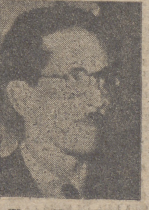
El presidente Siles, organizado en apoyo del dirigente del partido laboral, Juan Lechín, quien ha criticado la acción del Gobierno.—Efe.

La Paz, 4.—Las milicias de trabajadores han abierto fuego al aire sobre los que dirigen una manifestación que provocó disturbios en los alrededores del palacio presidencial. En la refriega, algunas personas resultaron heridas por las piedras lanzadas por los manifestantes. El presidente, Hernán Siles, al salir del palacio, fue llevado a hombros por los trabajadores. La manifestación se había organizado en apoyo del dirigente del partido laboral, Juan Lechín, quien ha criticado la acción del Gobierno.—Efe.