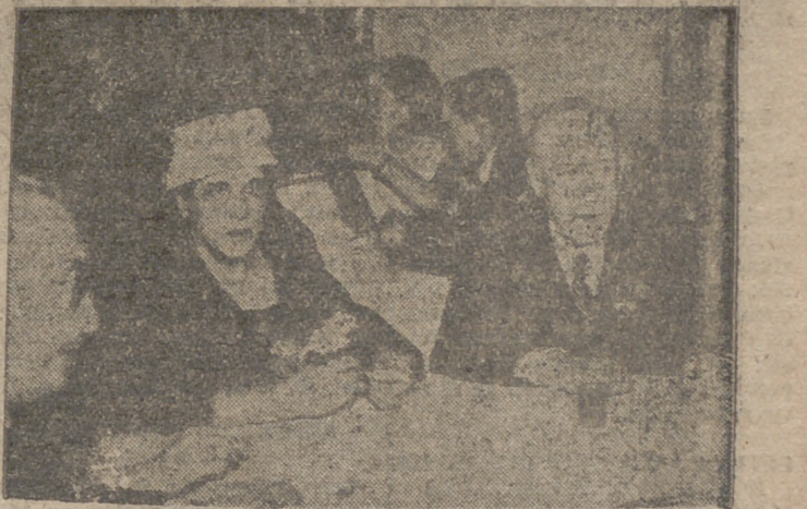
El Capitán General de la Región, señor Esteban Infantes, con su distinguida esposa, en la fiesta pro Campaña de Navidad que ayer se celebró con gran brillantez en el Hotel Gonda Anzures. (INFORMACION EN PAG. 25)