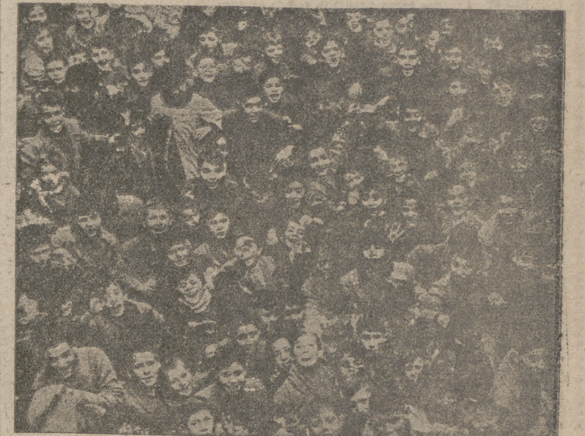
Cientos de chiquillos de clases humildes acogidos a la Obra «Pan y Catecismo» en uno de los mejores momentos que siguieron a la clausura del Cursillo correspondiente a ese año. (COMPLETA INFORMACION EN PAGINAS INTERIORES.)