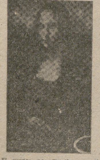
El cuadro nos muestra, en el ángulo superior, la señal de la piedra.

Un boliviano, expulsado de Francia, apedreado en el Louvre a la Gioconda. Quiere pasar el invierno en prisión