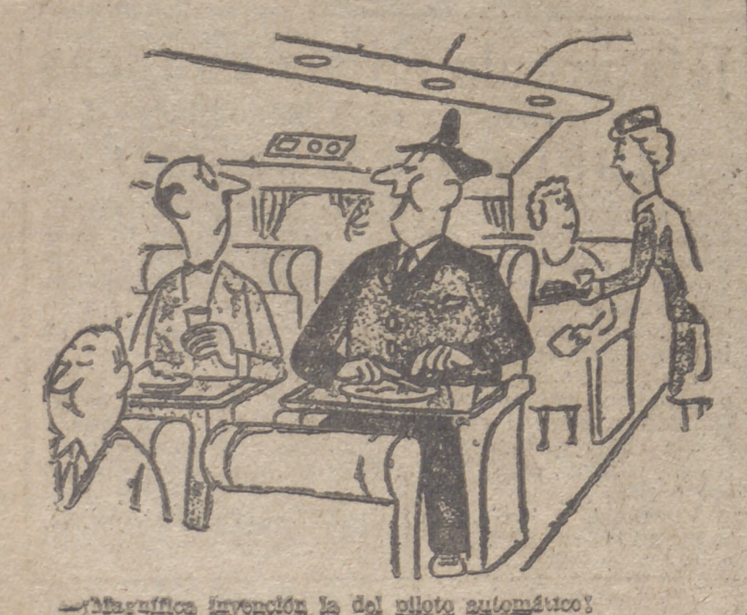
—Mágica invención la del piloto automático.