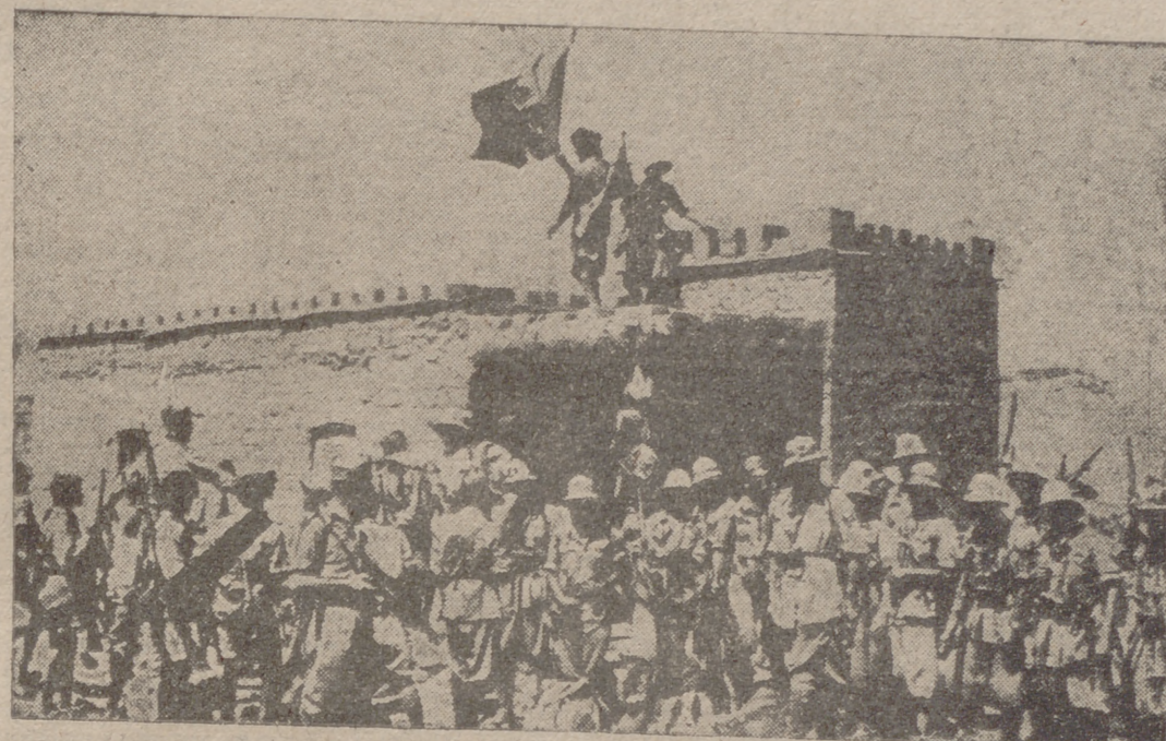
Ante el empuje italiano en Somalia, ha caído un fortín inglés, del que los vencedores arrian la bandera británica que será sustituida por la de Italia. El esfuerzo de estos soldados será, sin embargo, inútil, ya que el Régimen de Mussolini está siendo minado por una complacencia derrotista, hija de la traición y la cobardía. En este trabajo podrá observar el lector el fango moral en que pueden hundirse ciertas gentes para quienes los cigarrillos rubios y los dólares se sobrepone al honor y la libertad de la Patria.