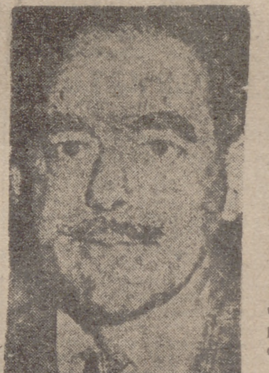
Acheson duda de que los comunistas chinos entren en Corea

Atenas, 5.—El jefe del Gobierno, Sofocles Venizelos, ha anunciado que Grecia había aceptado la invitación del Consejo del Pacto del Atlántico para tomar parte en los planes defensivos del Mediterráneo oriental.—Efe.