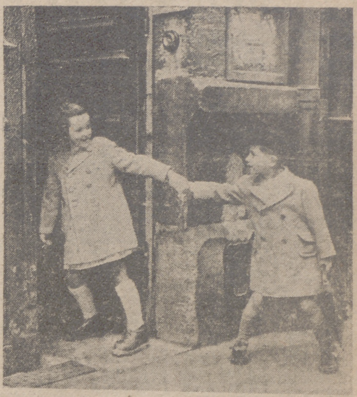
Y en el mundo entero, con la llegada del calendario, los escolares han resucitado sus carteras. Una vez más se ha renovado la odisea, en ese romper la inercia para someterse a la disciplina del encierro y a la tiranía del reloj.

No se sabe la fecha exacta en que se discutirá este asunto, pero se cree que será en breve.—Efe.