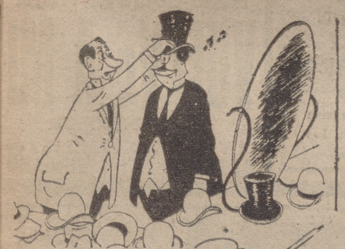
—En esta chistera podrá usted ocultar una antena de radio, para escuchar música cuando la ceremonia sea aburrida.