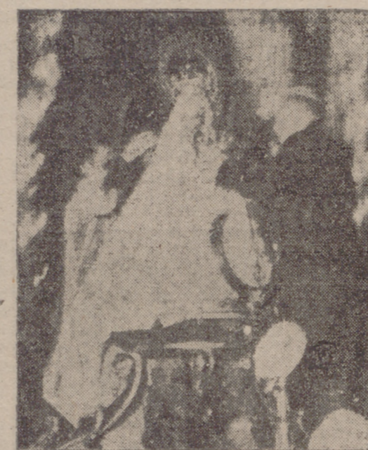
(Viene de la primera página.)