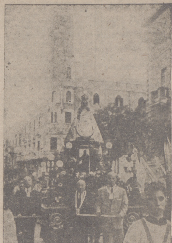
Entre el desbordante fervor de sus hijos, la Excelsa Patrona de Valladolid recorre las calles de la ciudad. Diríase que junto a la rica y preciada ofrenda material, los vallisoletanos obsequiaron a su Madre Amorosa con los mejores efluvios de sus corazones.