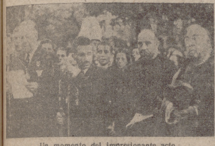
Un momento del impresionante acto