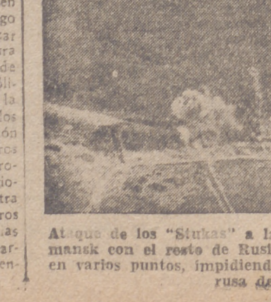
Ataque de los «Stukas» a la línea ferroviaria que a Murmansk con el resto de Rusia. Esta línea ha sido ya cortada en varios puntos...