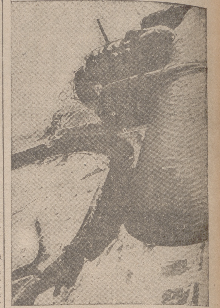
Un «Do 17 Z» volando sobre el Volga, cerca de Kalinin