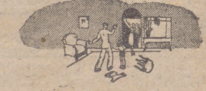
Los nerviosos se agotan tan muchas veces expuestas al desequilibrio de los nervios.