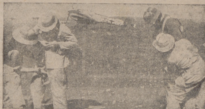
La tripulación de un "Me-110" se prepara para un vuelo

Bilbao, 28.—El nuevo matadero, cuyas obras han sido empezadas a su baga, será uno de los mejor instalados en Europa. Para su emplazamiento se ha elegido una superficie muy amplia en la zona de Zorroza, con fácil acceso a las carreteras, a la vía fluvial, donde se dispondrá de un museo de arte, y a los ferrocarriles de ancho normal y de un metro. El importe de las obras, que se realizarán en un 99 por 100 con materiales nacionales, se calcula en 18 millones de pesetas. La construcción se hará por el sistema de pabellones; así, se destinará un pabellón para cada uno de los siguientes servicios: Dirección y administración, establecimiento especial de aves, sanidad y laboratorios, tratantes y clientes, garajes, aprovechamientos industriales y otro para los generales de higiene, calefacción, bolsa de contratación, etc.—Cifra.