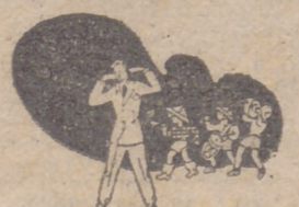
En ruidos, malestar estomacal, nerviosismo y una enfermedad de los nervios.