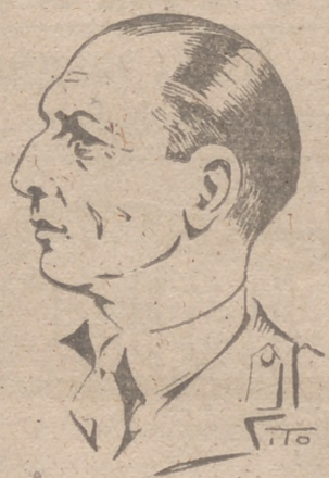
EL REY DE GRECIA

Canea (Creta), 28.—El presidente del Consejo de Grecia, Sudaeros, ha pronunciado un discurso ante los representantes de las organizaciones populares de Canea, en el que ha reafirmado la resolución del Gobierno de continuar la lucha hasta la victoria. Creta, símbolo eterno de toda lucha por la libertad—de la que se ha convertido hoy en el último, pero digno, reducto de los pueblos libres de Europa. El destino no ha escogido dos islas para esta misión excepcional: la gran Isla Británica y la gran Isla Helénica. Con constancia, valor y voluntad los pueblos de estas islas se batían hoy en la lucha suprema de la libertad. Si, M. el rey, encarnación suprema de nuestras aspiraciones, pensamientos y decisiones del país, se encuentra entre nosotros. El entusiasmo y el espíritu de la lucha contra el enemigo que han dado inculca a las pequeñas islas, como Lemnos y Samotracia, constituye un gran ejemplo dado por el pueblo helénico, que ha luchado durante tres meses contra un Imperio, al que ha vencido, y ha resistido durante veinte días contra los alemanes y sus impresionantes máquinas y no ha sucumbido más que después de épicas batallas, que han causado la admiración de amigos y adversarios. Lo que nos queda ahora, nuestras pequeñas islas, lucharán sin desmayos. Sudaeros concluyó diciendo: "El rey y el Gobierno se encuentran entre vosotros para la defensa suprema de Creta y del honor del helénismo. Los sacrificios no cuentan. Creta será un reducto de la civilización, de donde resurgirá