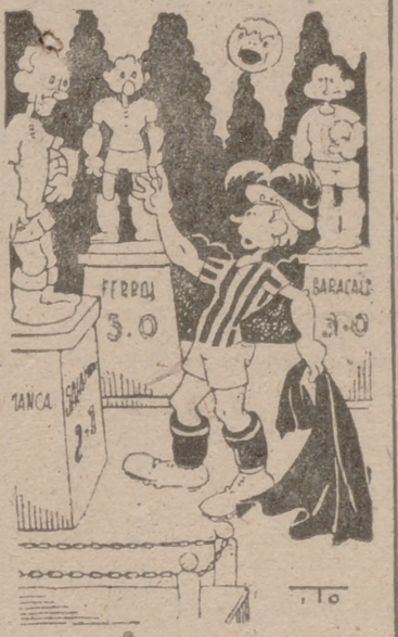
"Tenorio conquistador" nueva edición (Por ITO) "Yo soy vuestro matador como al mundo es bien notorio..."

Arbitro, Corpas. Jueces de línea, Echaniz y Muguruza. Los tres del Colegio guipuzcoano. Los equipos se almerano como sigue: Valladolid: José Miguel; Busquet, Sasot; Barrios, Torquemada, Rufio; Lizasoain, Estrada, Arienza, Zaurín, y Las Heras. Baracaldo: Gutiérrez, Aldazábal, Arzanegui; Petreñas, Castillo, Poli; Gumucio, Gozalo, Gárate, Bata y Larrasábil. ANDETER