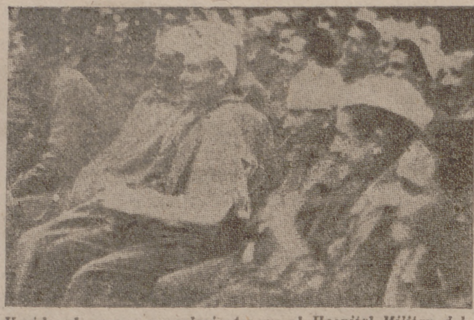
Heridos de guerra convalecientes en el Hospital Militar del Calle de Roma asisten a una representación teatral organizada por el Dopolavor

El primer ministro de Australia, Menzies, se encontraba en Plymouth durante el ataque, pero no ha sufrido ningún daño. Acababa de llegar a Plymouth procedente de Bristol para continuar su viaje por las provincias inglesas.—Efe.