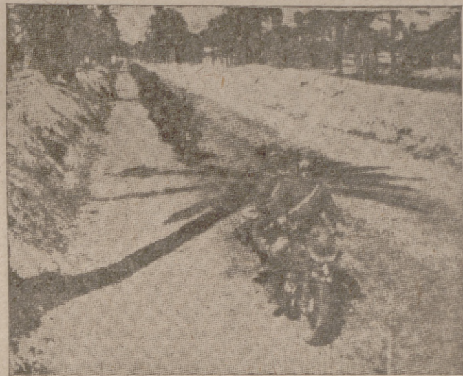
Los «bessallari» motoristas marchan, por la carretera de la costa libica, hacia la zona de operaciones

Esta hermandad y compenetración, logradas después de sacrificios continuos y de incansables trabajos, tuvieron primero un fiel reflejo en nuestra guerra, y ahora en esta paz operante que da sus frutos.