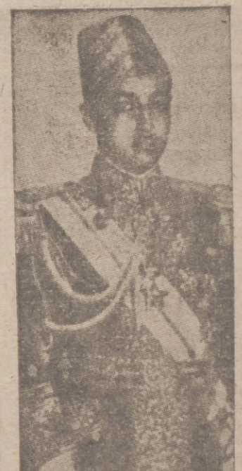
S. A. I. el jefe Muley Hassan, que el viernes hizo su entrada triunfal en Tánger

Moscú, 22.—En relación con el viaje de Matsuoka se anuncia que a su llegada a Moscú, que como ya se sabe se efectuará en la tarde de mañana, domingo, será recibido por Molotov. El lunes, a la una de la mañana, celebrará una conferencia con dicho comisario de Negocios Extranjeros. Matsuoka abandonará Moscú el mismo lunes a las once y veinte de la noche, con dirección Berlín.—Efe.