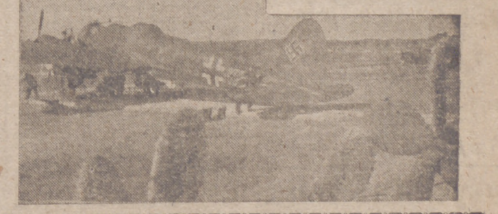
Los aviones alemanes "He 111" en los aeródromos italianos

Herrería artística.—Una de las más florecientes manifestaciones de la Artesanía clásica toledana es la herrería artística. Bastaría una visita a la Catedral Primada para darse cuenta de su importancia en la deslumbrante maravilla de sus innumerables rejas, de los siglos XV, XVI hasta el XIX, y aún de nuestros días, que no desentonan en