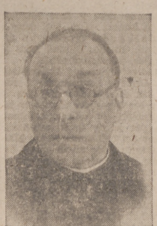
DR. GARCIA MORENTE