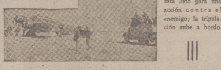
En una base aérea de Libia, en pleno desierto, un aparato de bombardeo está listo para una acción contra el enemigo; la tripulación sube a bordo.