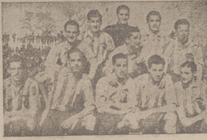
El equipo del Atlético Avilés, campeón de Liga