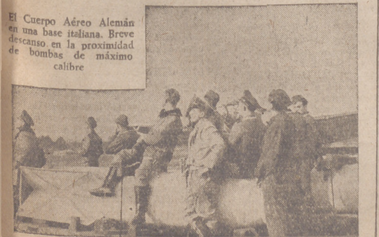
El Cuerpo Aéreo Alemán en una base italiana. Breve descanso en la proximidad de bombas de máximo calibre

Londres, 4.—El redactor diplomático de la Agencia Reuter escribe que la ruptura de relaciones diplomáticas entre Bulgaria e Inglaterra, que muy posiblemente, será anunciada hoy por el ministro de Inglaterra en Sofía, no significará que vaya a ser seguida necesariamente por la declaración de guerra. Sin embargo—agrega—, los búlgaros están adoptando medidas que no son precisamente una afirmación de neutralidad.—Efe.