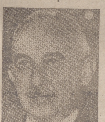
ISMET INONU, presidente de Turquía