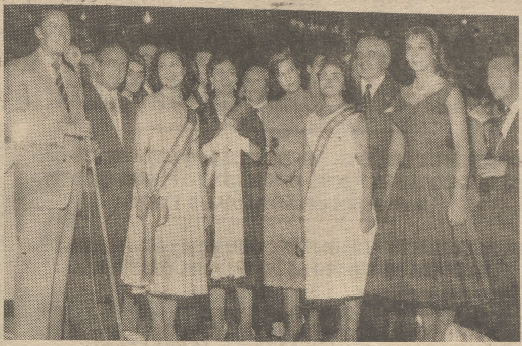
Anoche fué fiesta grande en la señorial kermesse de Chamartín de la Rosa, en donde, con la asistencia de Emma Penella, Elsa Montes, Cesáreo González y otros grandes de la pantalla española, fué elegida la "Señorita Rosa de Chamartín".