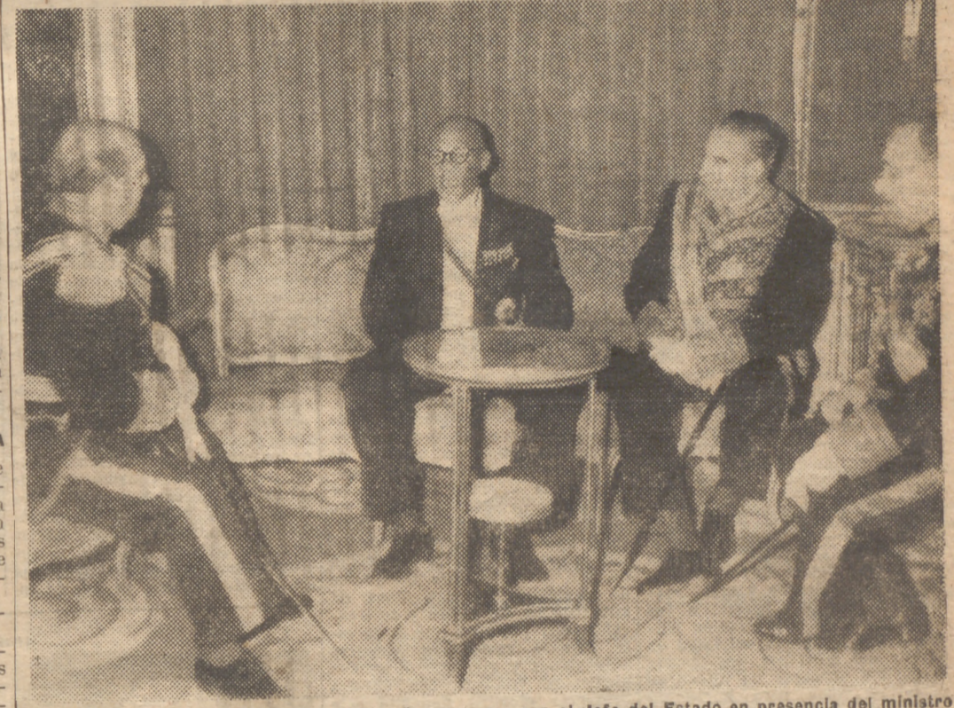
El nuevo embajador de Liberia en España conversa con el Jefe del Estado en presencia del ministro de Asuntos Exteriores, después de su presentación de cartas credenciales, esta mañana, en el Palacio Nacional.

to en Stuttgart frente al peligro del Este no han sido, sin embargo, cantos líricos. Allí estaba el viejo estadista alerta y vigilante para que la ley del servicio militar obligatorio, en favor y en contra de la cual habían abierto ya fuego las vanguardias de los partidos, no peligrase. Y esta primera lectura en la Dieta Federal fué aprobada por gran mayoría. Esta aprobación es prenda segura de que en la tercera y última encontrará también votos de sobra. El Ejército de los 500.000 hombres, si no está ya en pie, se está aupando sobre las piernas de acero del servicio militar obligatorio, pese a los socialistas y, en parte, a los liberales.