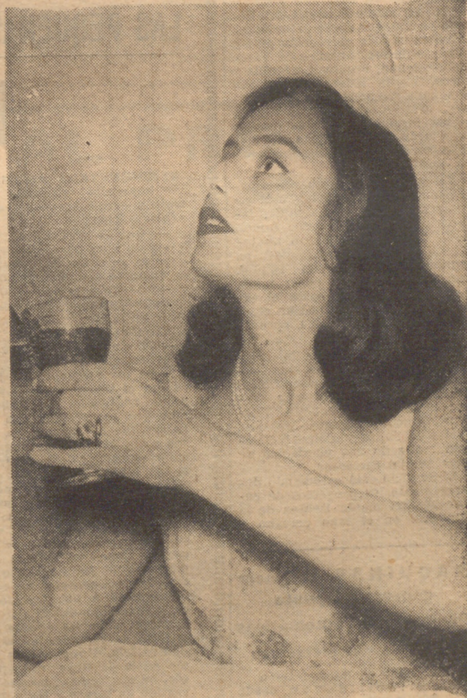
La conocida estrella del cine italiano Marina Berti se halla estos días en Madrid. El motivo del viaje es estrictamente turístico y privado. No obstante, ayer celebró una conversación con los periodistas madrileños.

20 millones más de coches y 53 mil víctimas del tránsito