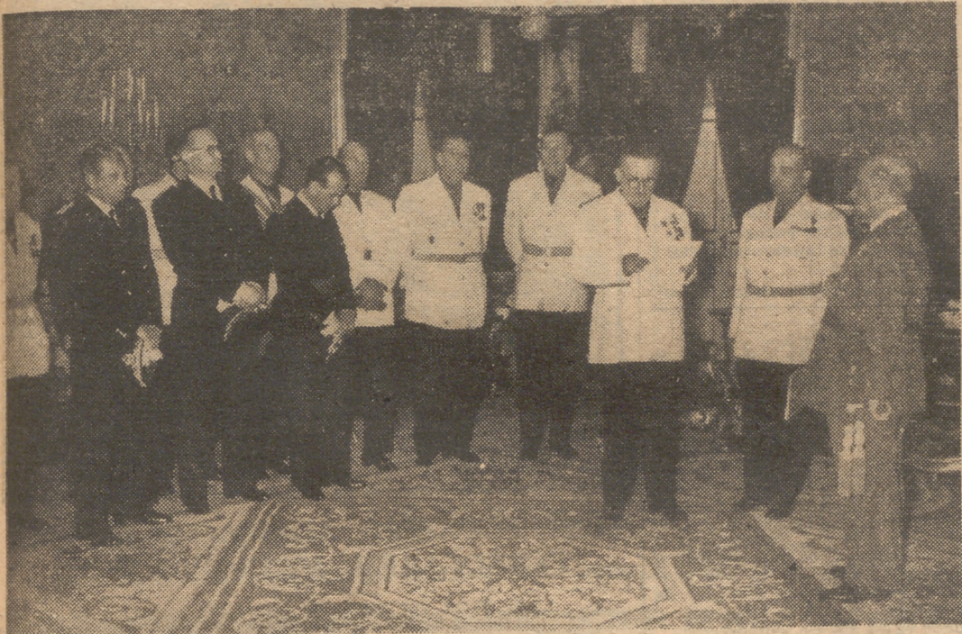
Su Excelencia el Jefe del Estado recibió ayer en audiencia al Consejo Económico Sindical de la provincia de Jaén, que iba presidido por el delegado nacional de Sindicatos, señor Solís; vicesecretario nacional de Ordenación Económica, señor Cancor, y las primeras autoridades de aquella provincia.