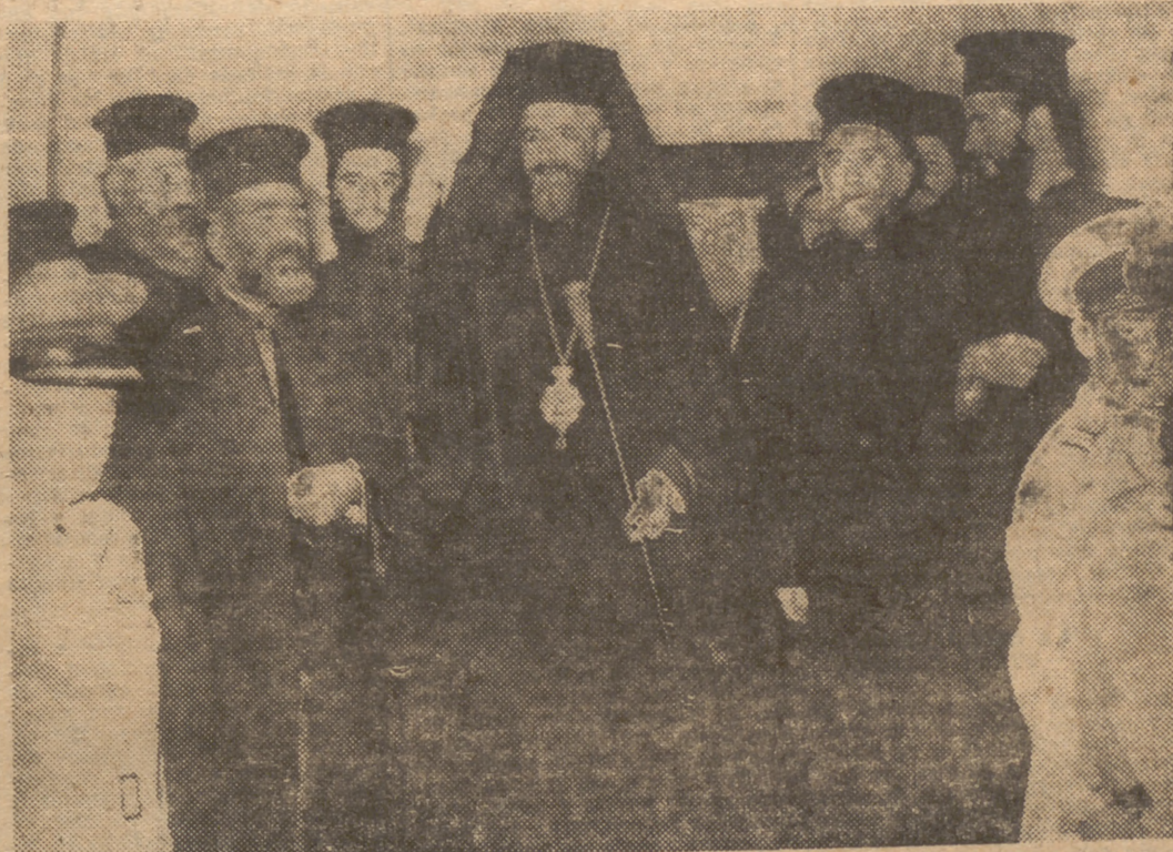
Vemos aquí al tenaz jefe espiritual y político chipriota, Makarios, a su llegada a Atenas, donde se entrevistó con el jefe de Gobierno griego, Karamanlis, días antes de ser deportado a Maho (islas Seichelles) por los ingleses.