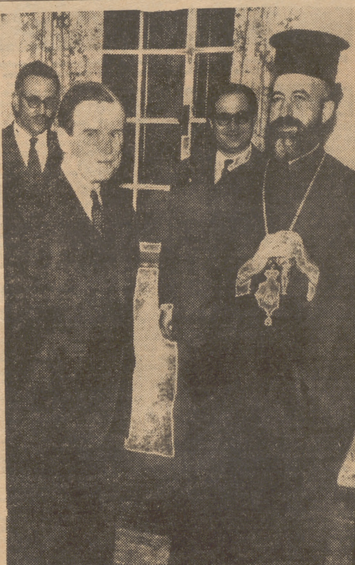
Una de las numerosas reuniones de Makarios con el gobernador británico de la isla de Chipre, mister Harding, para procurar resolver las diferencias sobre los puntos de vista inglés y chipriota. Inglaterra ha estimado que la solución estaba en deportar al arzobispo, pero los hechos proclaman todo lo contrario.

PUEBLO SUPLEMENTO PUEBLO PUEBLO PUEBLO PUEBLO INTERNACIONAL PUEBLO