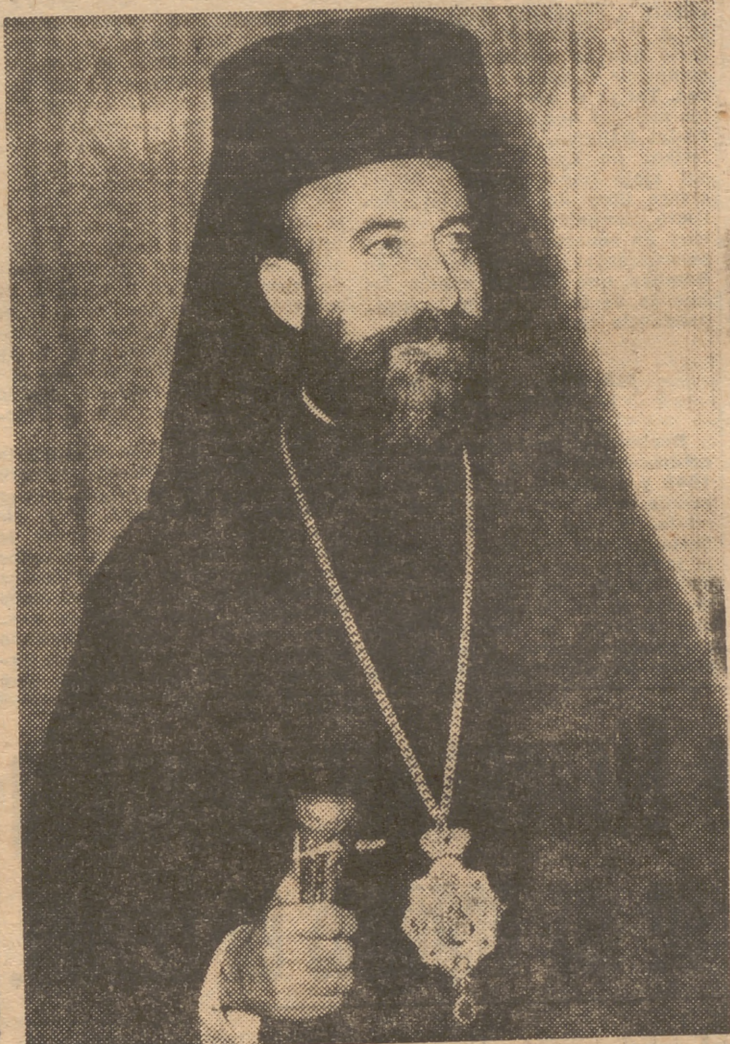
La más reciente fotografía del arzobispo ortodoxo griego Makarios, portavoz del anhelo chipriota de independencia.

Quando en agosto último se reunieron en Londres los representantes de Inglaterra, Turquía y Grecia para buscar solución a su disputa sobre Chipre, el arzobispo Makarios advirtió que los chipriotas no se considerarían iludidos por las decisiones de la Conferencia londinense. La presencia turca estaba fundamentada en el hecho de que Turquía cuenta con una minoría chipriota de un quinto aproximado del total de la población, que se calcula en 500.000 habitantes. Los turcos desean que los ingleses expulsen al terrorismo nacionalista y mantengan el "statu quo".