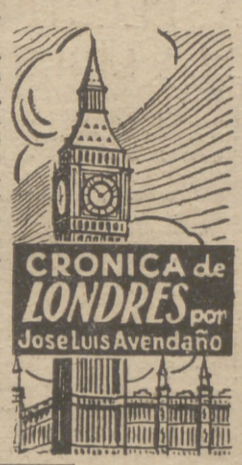
CRONICA de LONDRES por Jose Luis Avendaño

Entre ellas, las referentes a la legislación matrimonial. En Es-