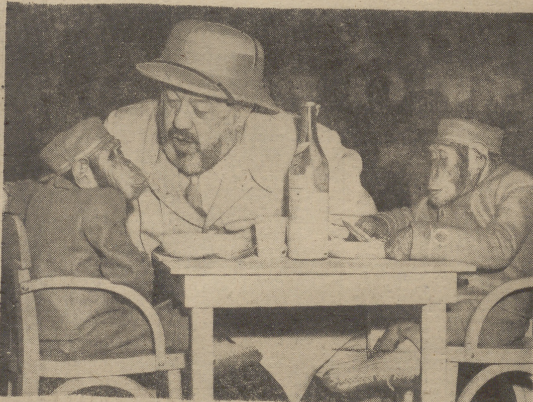
Esta pareja de correctísimos monos actuará bajo las órdenes del popular actor francés Michel Simon en una función benéfica de circo para allegar fondos con destino a los artistas ancianos y necesitados de la capital francesa. Ahora bien, quizá por un fenómeno de mimetismo, el señor Simon presenta un extraordinario parecido con sus dos peludos colaboradores. De ahí que el número se titule "¿Cuál de los tres?".