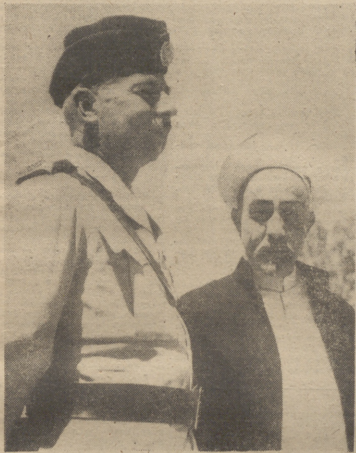
El difunto Rey Abdullah de Jordania con el teniente general Glub Bajá.

“Un duro golpe para el prestigio británico en Oriente Medio”