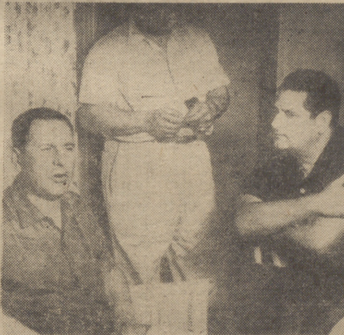
Perón habla en Panamá con sus compañeros de exilio.

REVELACIONES CONTENIDAS EN SU LIBRO: “LA FUERZA ES EL DERECHO DE LAS BESTIAS”