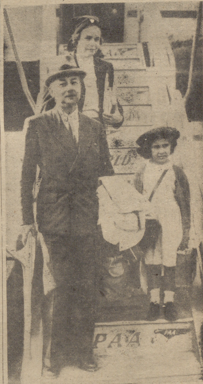
Una fotografía poco conocida del famoso Glub Bajá, jefe de la Legión Árabe hasta ahora. Aparece de paisano en el aeropuerto de Londres, acompañado de su esposa y una pequeña árabe que adoptó. (Foto Gira.)

Se dice que el primer ministro, sir Anthony Eden, está en comunicación transatlántica con el Presidente Eisenhower para tratar sobre los medios de asegurar que el Pacto no se desahoga. (Efe.)