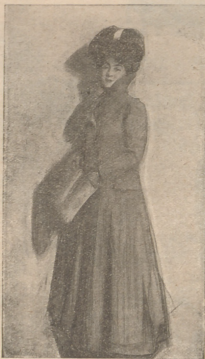
Recopilación de los Almanacos de la Casa

EL ECO DE LA MODA — E. Richardin, P. Lamm y C. BARCELONA