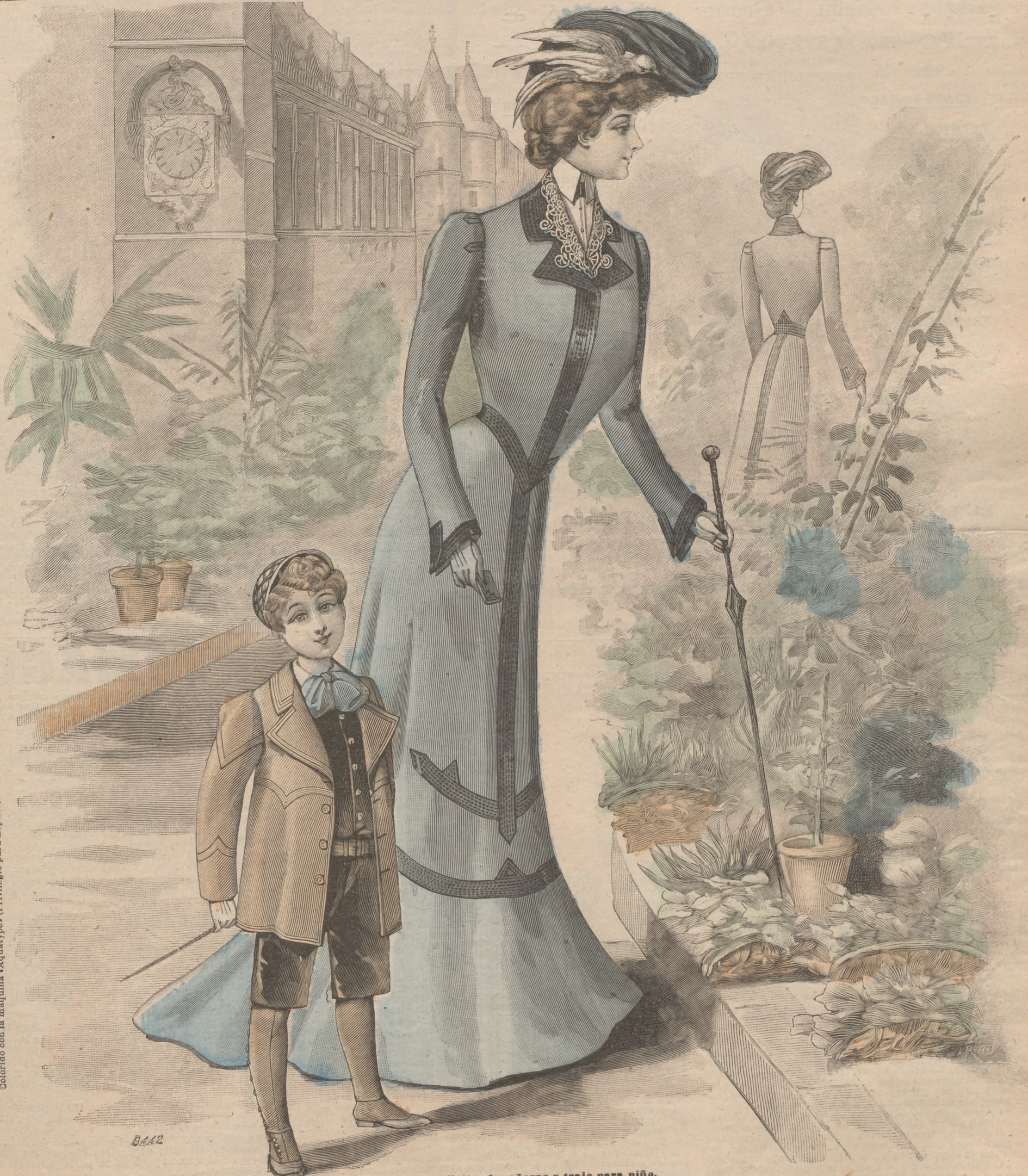
1. Toilette de señoras y traje para niño.

SUSCRIPCIÓN 6 Meses. 1 Año. En toda España. 4 pts. 7'50