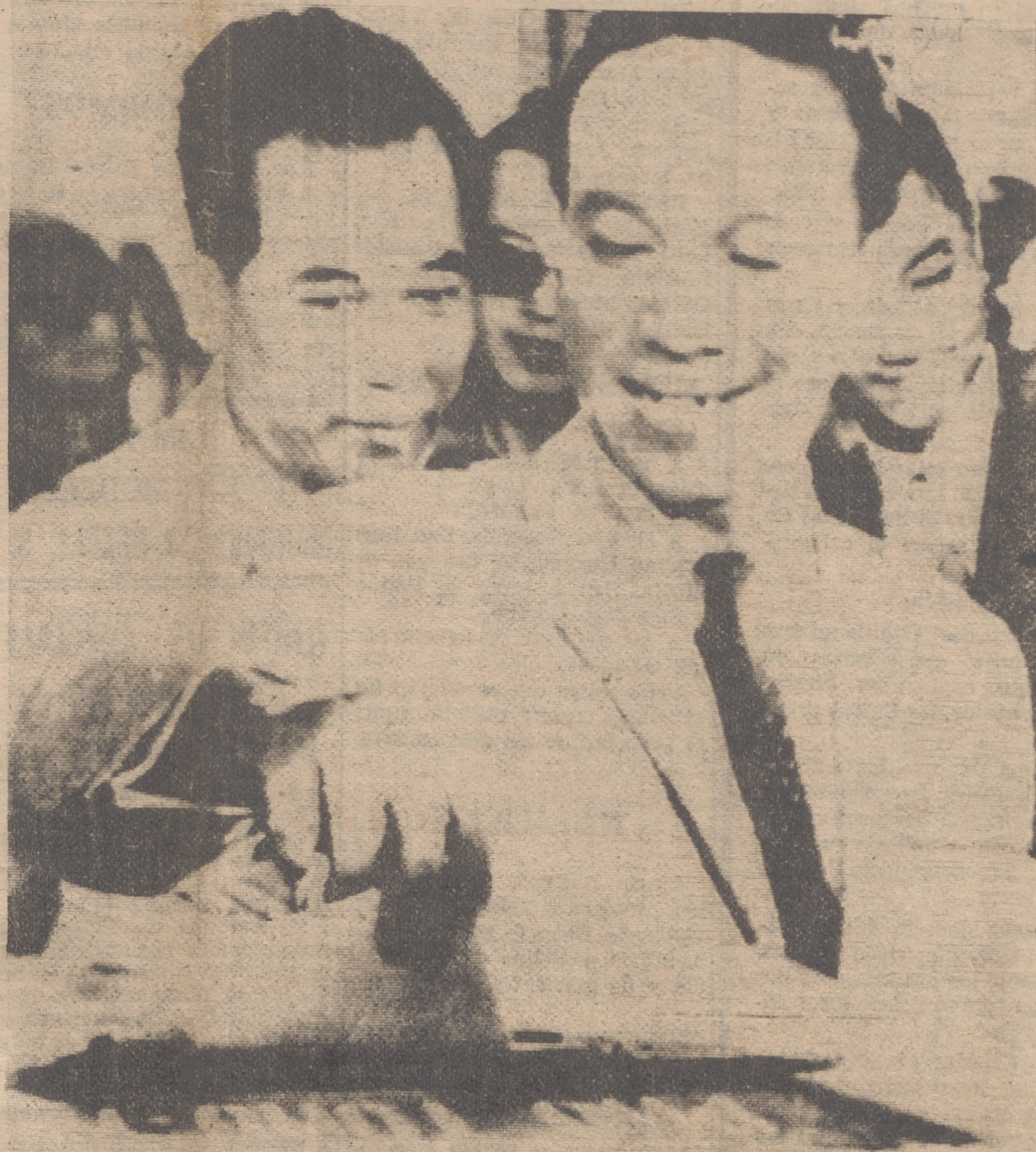
Momento en que el general Nguyen van Thieu, jefe del Estado survietnamita, deposita su voto en las elecciones presidenciales celebradas el pasado domingo. Van Thieu era el gran favorito en la votación

Cuando se terminó el recuento del 75 por ciento de los votos depositados, el escrutinio dio una clara y destacada mayoría a Van Thieu sobre sus oponentes, contando 8.570.365 votos, frente a los obtenidos por el pacifista Dao, 709.577 y 431.460 de Huong.