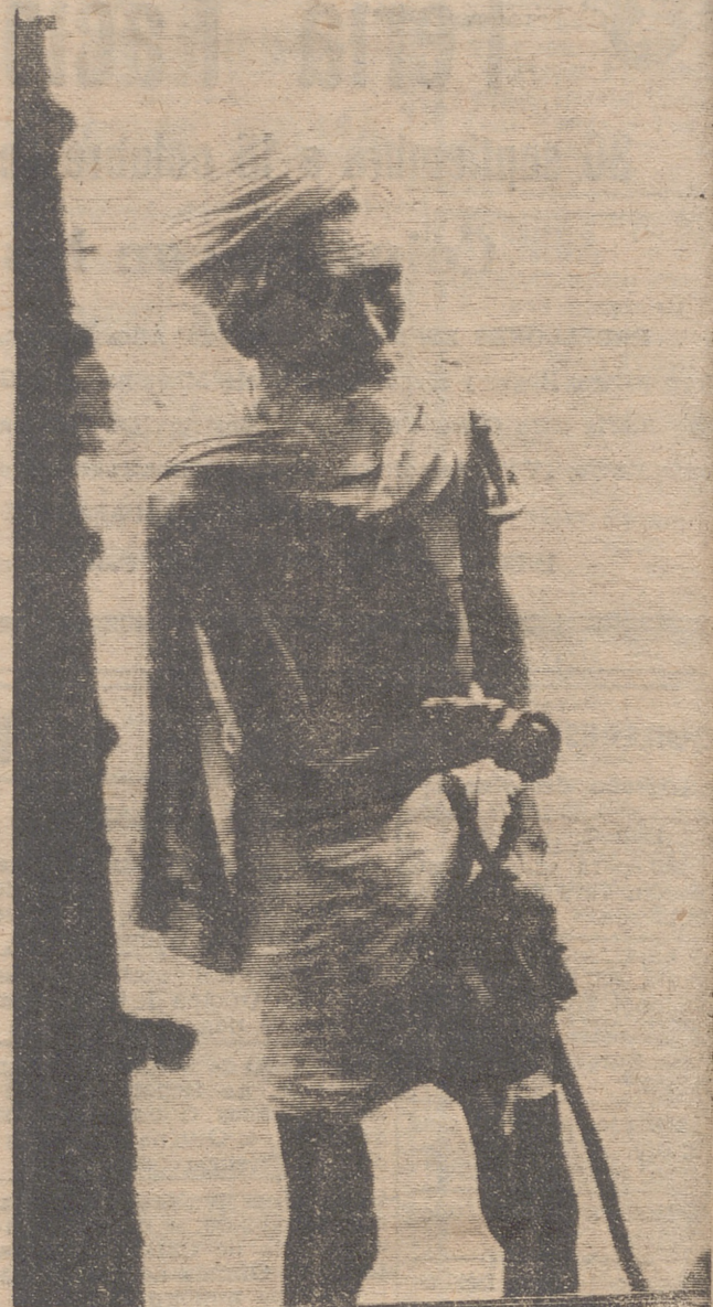
Un anciano mendigo, pidiendo limosna ante la puerta de un tren.

El fenómeno trascendental de la India independiente es la