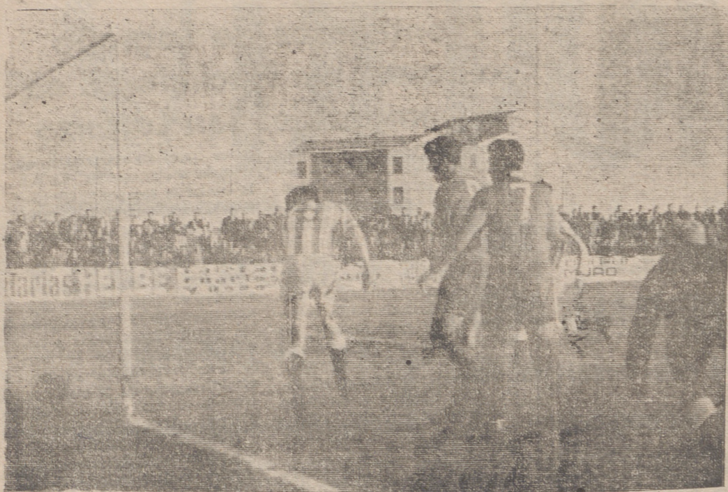
Segundo gol del Calahorra.

"El título mundial sigue pendiente de adjudicación"