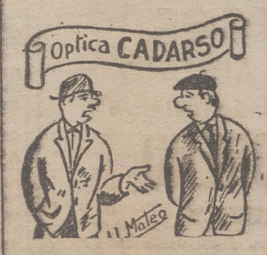
--Vamos mejorando, don "Hincha"; esta vez sólo fue un 2-0. --Claro, don "Forofó"; la delantera se va afianzando... en la defensa...