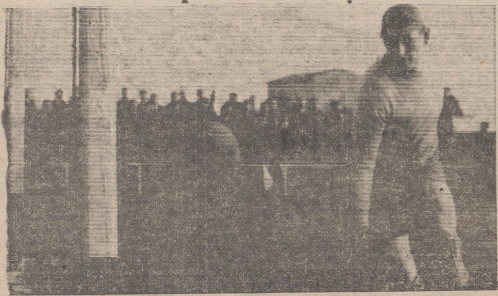
Una mala suerte del Haro. Como se ve gráficamente el balón roza el larguero.—(Foto Donezar)

Hemos querido conocer de una manera directa los acontecimientos sucedidos en torno a la final del campeonato mundial manomanista.