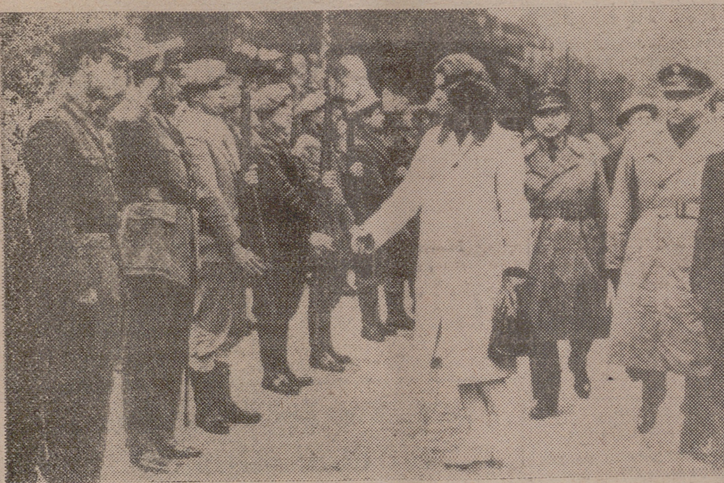
ATENAS. — La princesa Irene ha visitado, a pesar del mal tiempo, varios pueblos de la zona fronteriza con Albania. Repartió presentes entre los necesitados y se interesó por sus problemas. En la foto, la princesa pasa revista a un destacamento de la Guardia de Defensa Civil, creada para evitar un posible ataque albanés.