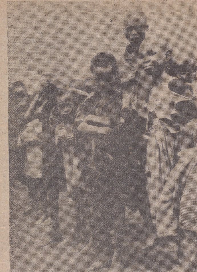
¡Increible! Muchos van vestidos así. Vuestros vestidos usados podrán hacer un gran servicio.

De la Península: Máxima, a Almería, con 17 grados, y mínima, a Pamplona, con ocho grados bajo cero.