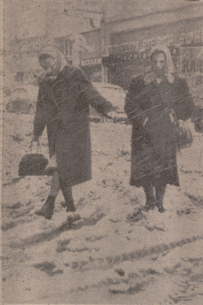
Pocos comentarios necesita esta fotografía obtenida en Viena. En ella, el autor ha dejado testimonio y admiración de la dura jornada del ama de casa, que pese a las inclemencias del tiempo, han de salir a la calle en busca de las provisiones necesarias, de todo aquello cuanto es preciso para que el hogar siga su marcha de cada día.