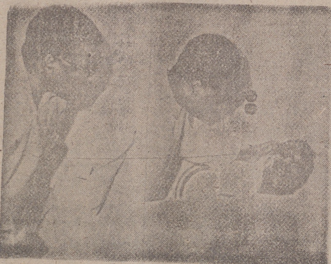
ACCRA. -- Cuatro muertos y ochenta y cinco heridos fue el balance del último de los atentados sufridos por el presidente Nwame N'Krumah, que aparece en la fotografía visitando a uno de los heridos internados en el Hospital Militar de Accra.