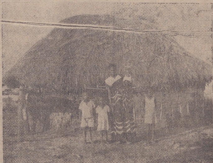
Casa de la enfermera del dispensario, con paredes de barro y de caña. Parecida a ésta son casi todas las casas de Burundi.

Acción de gracias. A todo lo ancho y largo de nuestra querida Rioja nunca me faltaron colaboradores. Ayudas apostólicas y ayudas económicas para la construcción de la Casa de Ejercicios de Santurde y para el Colegio de Los Boscos, ayudas que vinieron de los sitios más alejados y de todas las clases sociales. El gran Crucifijo que preside la capilla de la Casa de Ejercicios y uno de los cálices los regalaban los obreros riojanos con el dinero que peseta a peseta recaudaron por todos los lugares