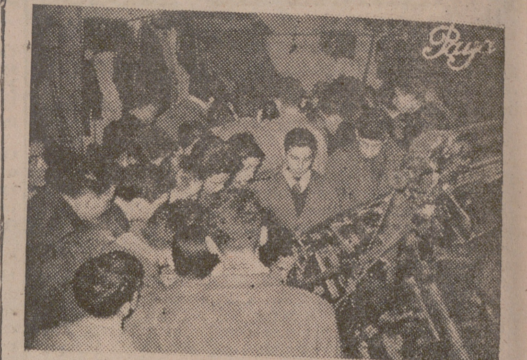
Días pasados, un grupo numeroso de alumnos de sexto curso de Bachillerato visitó, en compañía de sus profesores, los Talleres y Dependencias de nuestro periódico. Dicha visita, que forma parte de las prácticas de acción escolar del presente curso, resultó muy interesante. El grabado representa el momento en el que se les explicó el funcionamiento de las linotipias.

Onassis, que cenó anoche con el príncipe Rainiero y la princesa Gracia de Mónaco declaró: "Como ustedes comprenderán, no puedo hacer ningún comentario a la noticia. Debo enterarme antes de lo que hay sobre el asunto y leer el texto de la petición. Después haré una declaración pública". —(Efe).