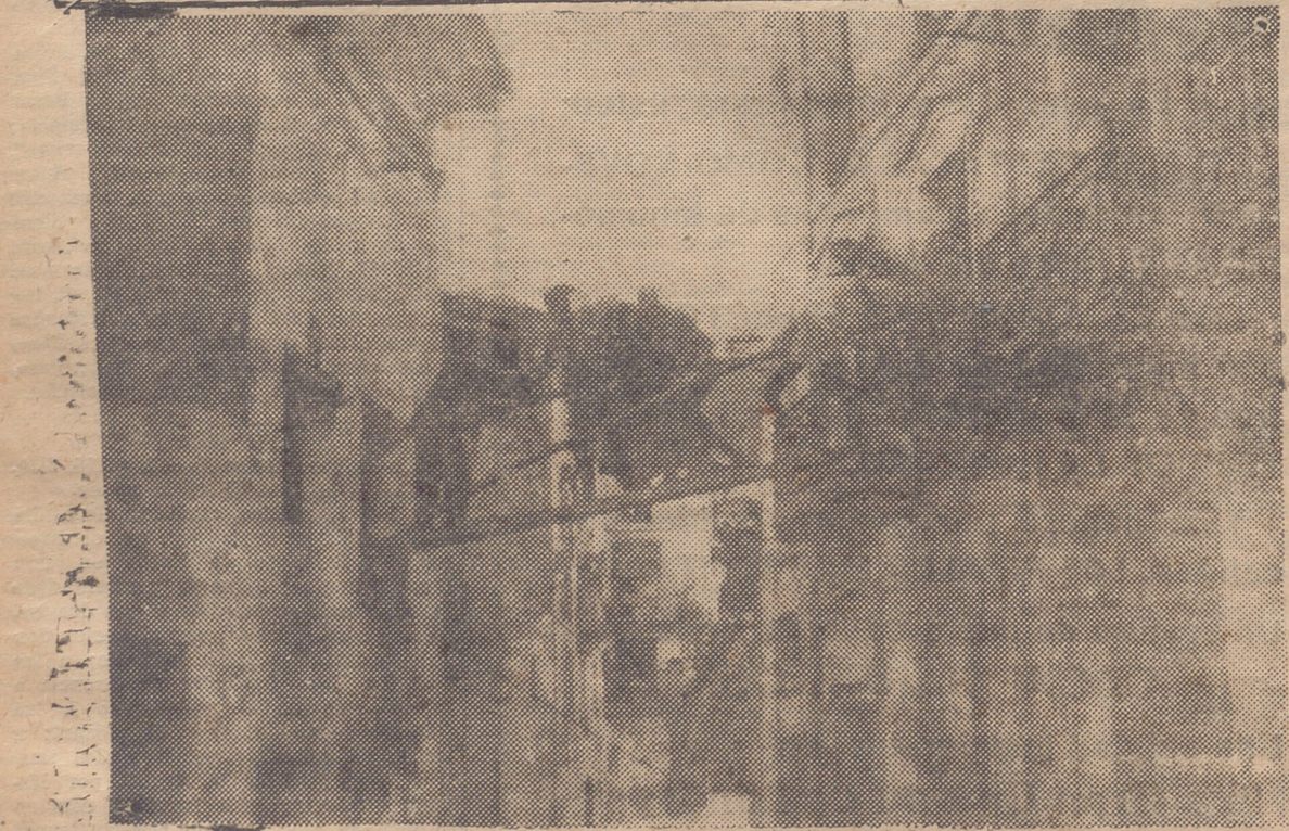
ARNEDILLO.—UN SALVAMENTO EN LA CASA DEL SEÑOR MAESTRO. TRASLADO DE LOS VECINOS A LA CASA QUE FUE POSADA