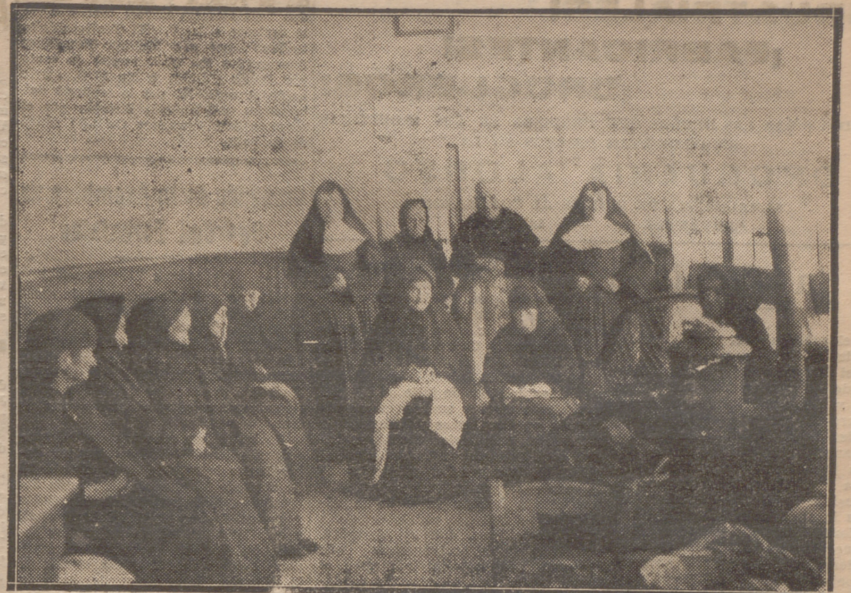
EN LAS HERMANITAS DE LOS POBRES.—ANCIANAS DESAMPARADAS QUE SE REFUGIAN EN EL AMABLE AMBIENTE DEL ASILO, Y EN EL TRATO CARINOSO DE LAS MONJITAS, CONVERSAN Y HACEN COSTURA AL AMOR DE LA ESTUFA