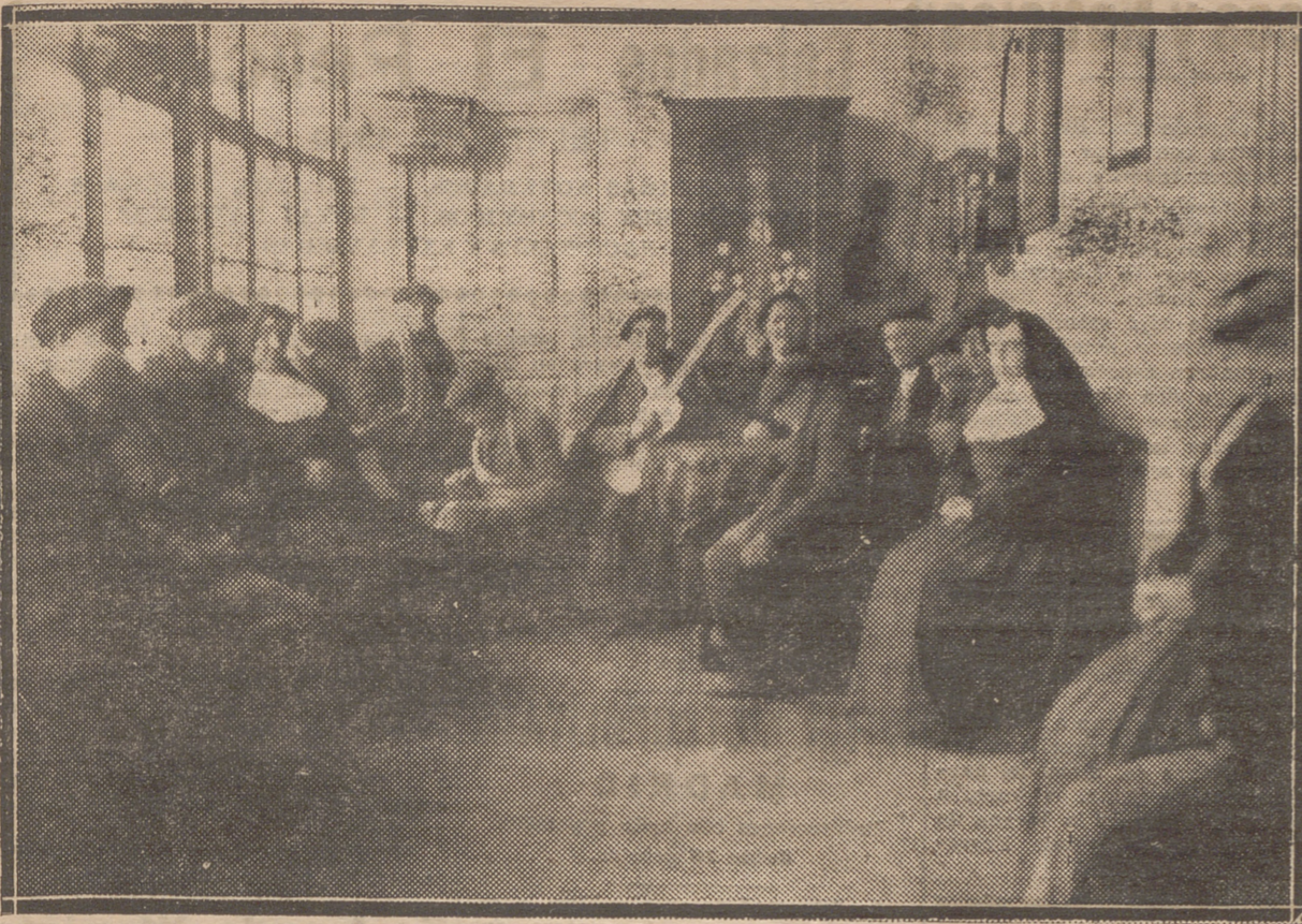
EN LAS HERMANITAS DE LOS POBRES.—LOS ANCIANOS ASILADOS HABLAN, LEEN Y HASTA HACEN UN POCO DE MUSICA CON LA GUITARRA EN EL TEMPLADO Y ALEGRE AMBIENTE DE UNA GALERIA ENCRUSTALADA QUE RECIBE EL SOL DEL MEDIODIA