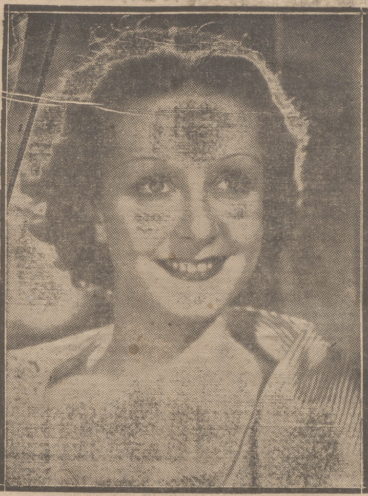
DANIELE DARRIEUX, ESTRELLA DEL CINE FRANCEO