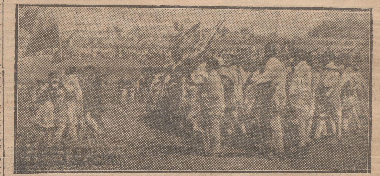
LOS ABISINIOS QUE MARCHAN AL FRENTE, DURANTE UN DESFILE EN ADDIS ABEBA

Oficialmente, el Ejército etíope no ha entrado todavía en acción, de acuerdo con el plan de espera a que