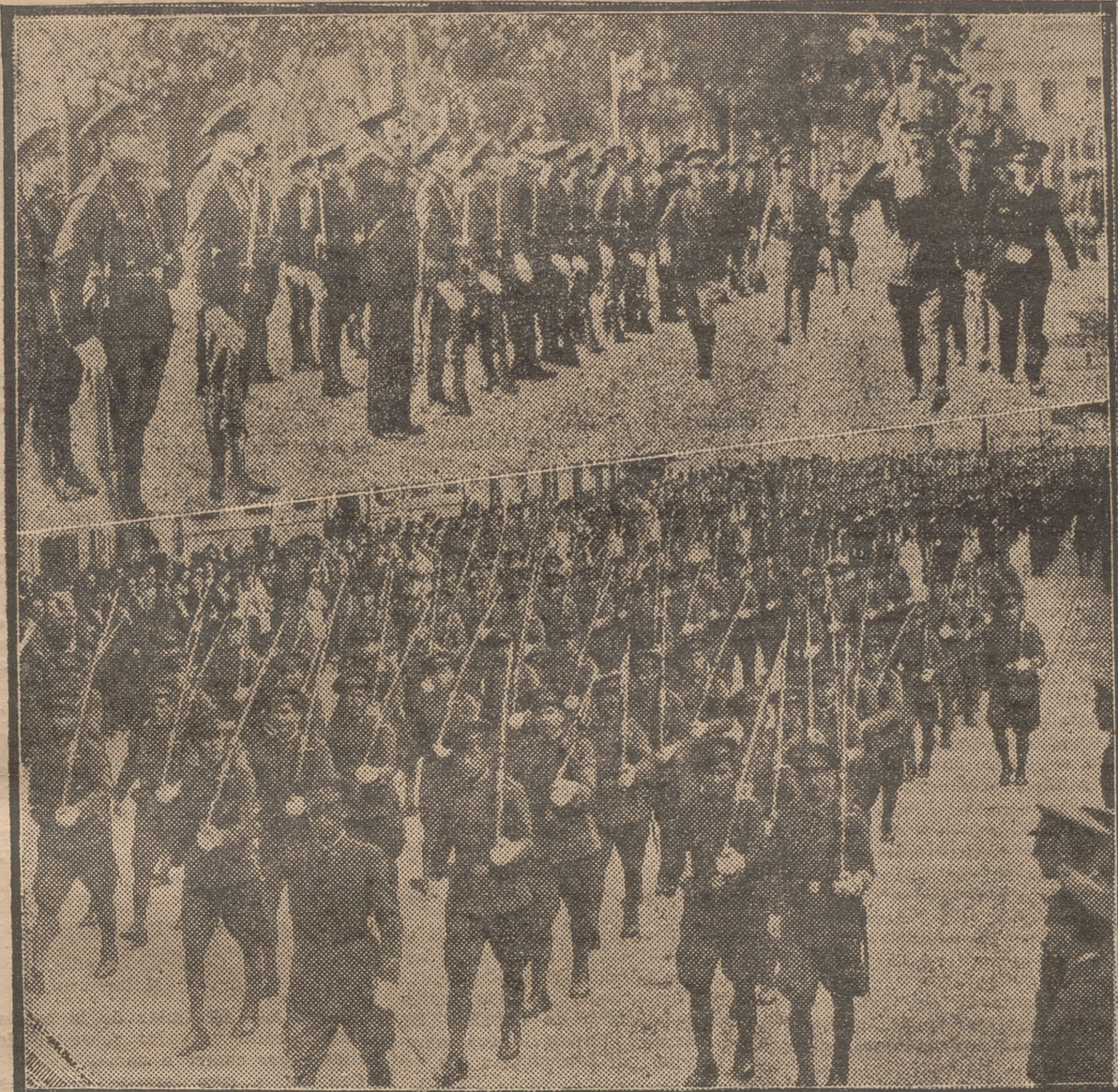
EL GENERAL CARRASCO REVISANDO LAS TROPAS DURANTE EL ACTO MILITAR DE AYER. LA INFANTERIA, DESFILANDO.