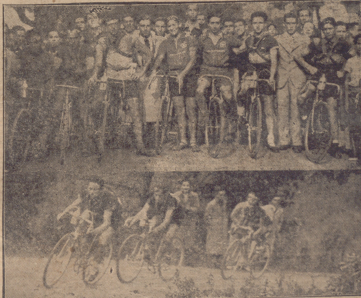
OTRO ASPECTO DE LA VUELTA CICLISTA A PIQUERAS Y LOS CORREDORES ANTES DE LA PARTIDA.