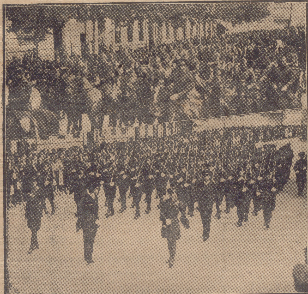
DE LA FIESTA DEL SOLDADO EN LOGROÑO.—FUERZAS DE ARTILLERIA Y AVIACION EN EL DESFILE

Oculista Exalumno del Hospital de Valdehilla. Once de Junio, 18, entré. Tel. 1463