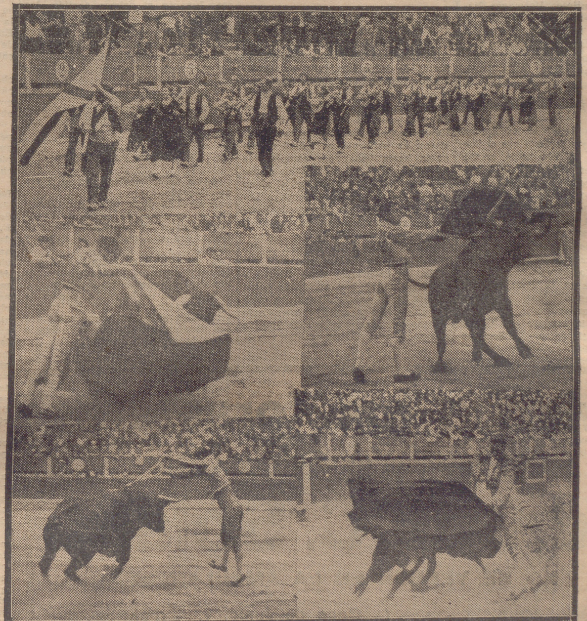
DE LAS DOS ULTIMAS CORRIDAS.—DESFILE DE LA RONDALLA DEL CENTRO RIOJANO DE MADRID. VARIOS MOMENTOS DE LA LIDIA.