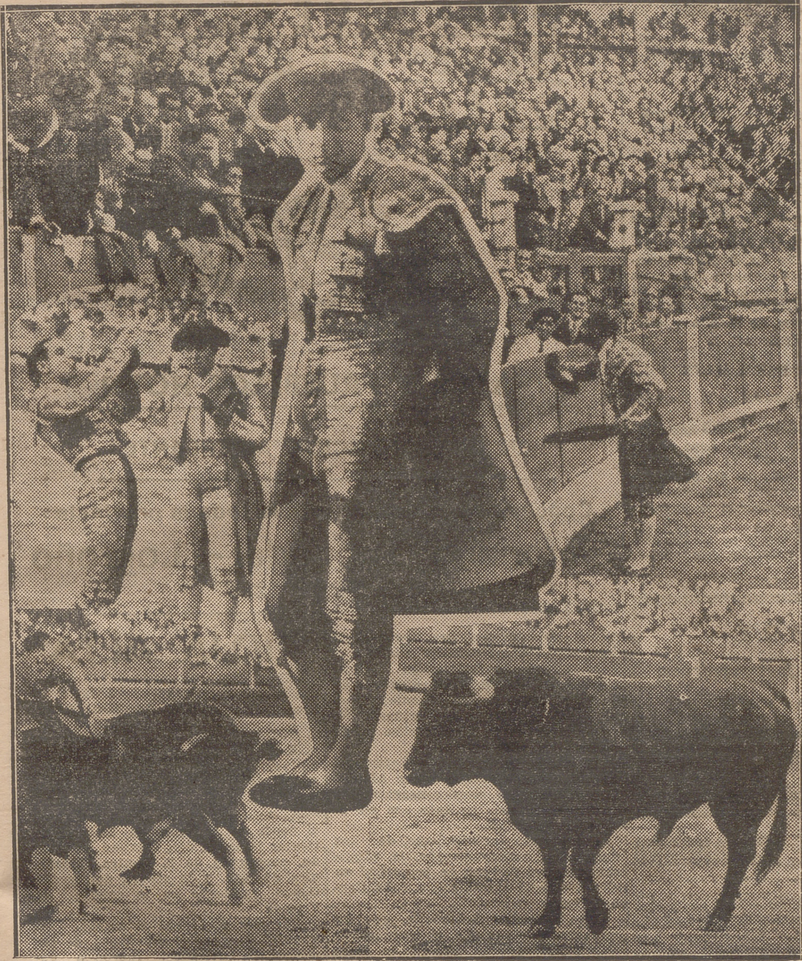
DE LA DESPEDIDA DE BARRERA EN LA CORRIDA DEL DOMINGO.—UN ALTO EN LA VUELTA AL RUEDO. EL ULTIMO BRINDIS DE SU VIDA TORERA. UN PASE DE LA FIRMA. EL ULTIMO TORO QUE MATÓ