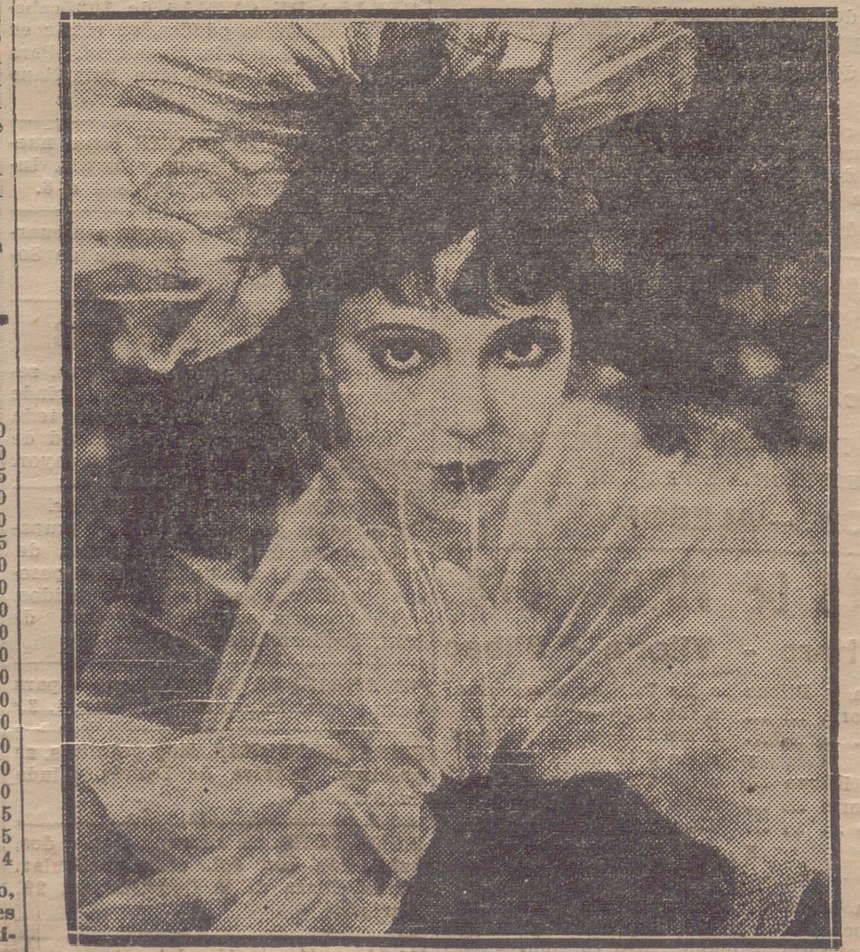
JESSIE MATTHEWS, ESTRELLA INGLESA DE LA GAUMONT-BRITISH