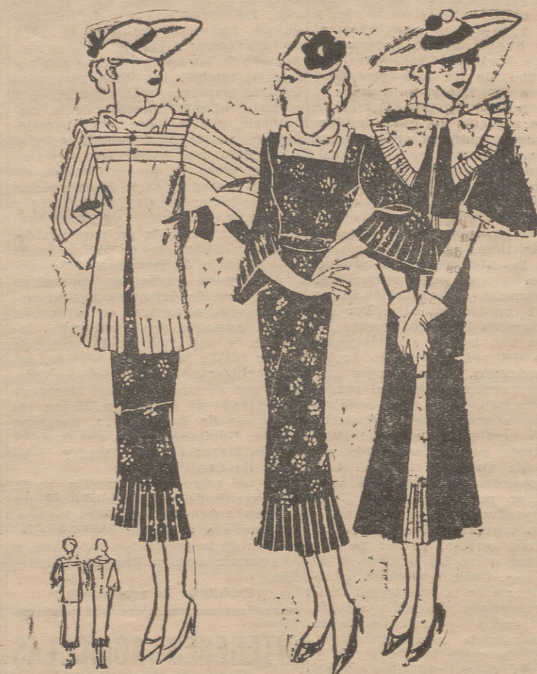
Conjunto de "foulard" impreso azul marino y limón. Pequeño abrigo en "kasha" limón. En la falda, mangas y escote del abrigo, nervadura. Conjunto de vestido impreso con volante plisado en la parte inferior de la falda y un voluminoso nudo en el escote. Mangas en forma de capa. Abrigo azul marino. Cinturón de ante blanco.

¿Qué se puede hacer, pues, para compaginar las ventajas del deporte femenino con los trastornos sanguíneos y cutáneos que son naturales