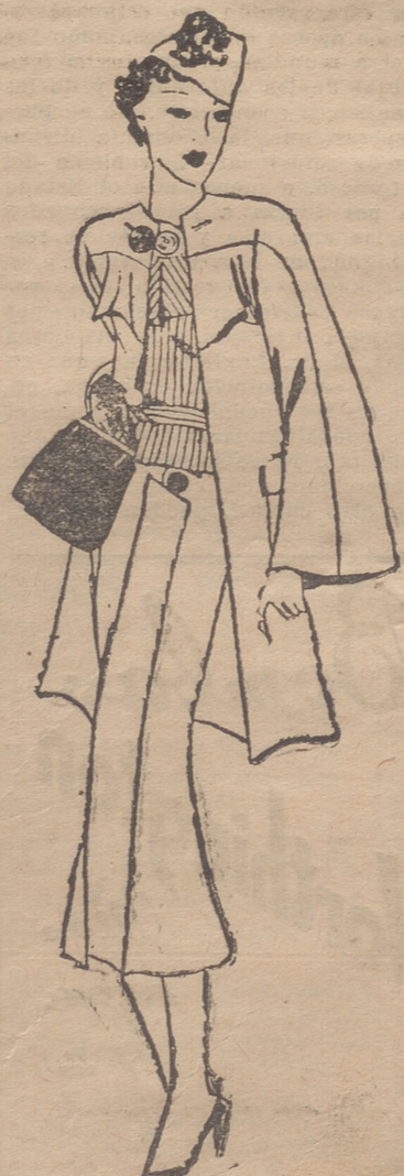
Conjunto en "chiné antitroiss" gris o azul marino. Cortes en la falda formando bolsillos con grueso botón. Blusa "camisera", a juego con el colorido del conjunto, que termina en vasca con la falda.

Para más de diez convidados se pondrán dos entradas o bien se servirá después del asado un plato fiambre. Se llama principio un pescado servido en caliente, un "vol-au-vent", timbales, pasteles calientes, et-