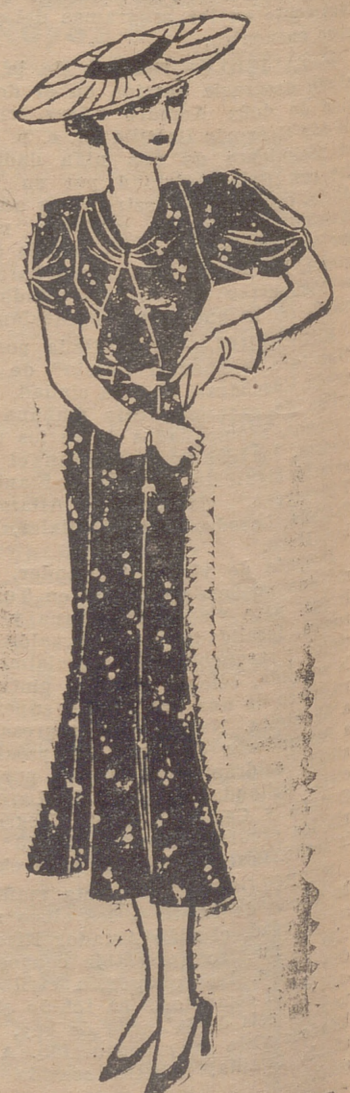
Elegante vestido en "marrocaín" impreso. El cuerpo y las mangas abrochados y drapados.

Las manchas verdes que se producen al sentarse en el campo, se hacen desaparecer frotándolas con un cepillo impregnado en alcohol, lavándolas después con agua y jabón.