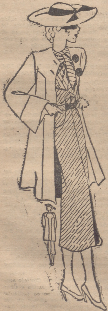
Vestido de crespón "chiné antitroiss", azul claro, estampado a rayas azul oscuro y blanco. Mangas "tres cuartos". Falda unida al cuerpo por cortes. Un pliegue en la delantera le da vuelo. Abrigo gris "tres cuartos" cerrado por gruesos botones.

La proximidad del verano ofrece también combinaciones de organdi y sedas estampadas, crespones, "foulards", "glassés"... Como ejemplo de moderada fantasía, propicia a las horas de sol tibio de la ciudad, el campo y la montaña—aun no de la playa—hay unos deliciosos modelos post primaverales, claros, de estampados o impresas margaritas, amplias y blancas sobre un fondo de azul zafiro. Perfectos en su entallado insinuante, estrecha la falda, ajustadísimo al cuerpo, al cual se halla unido el cinturón, bajo el cual dos volantes—élitros y alas de la indumentaria de primavera—de escaso vuelo apenas rizan en supuesta haldeta sobre el comienzo de la falda en biés. Bajo los abiertos delanteros del cuerpo sin adorno, de estos modelos, aparece un simpático camisolín en organdi labrado, plegado en jaretas que ajustan el vuelo de los volantes, remate de las mangas, y