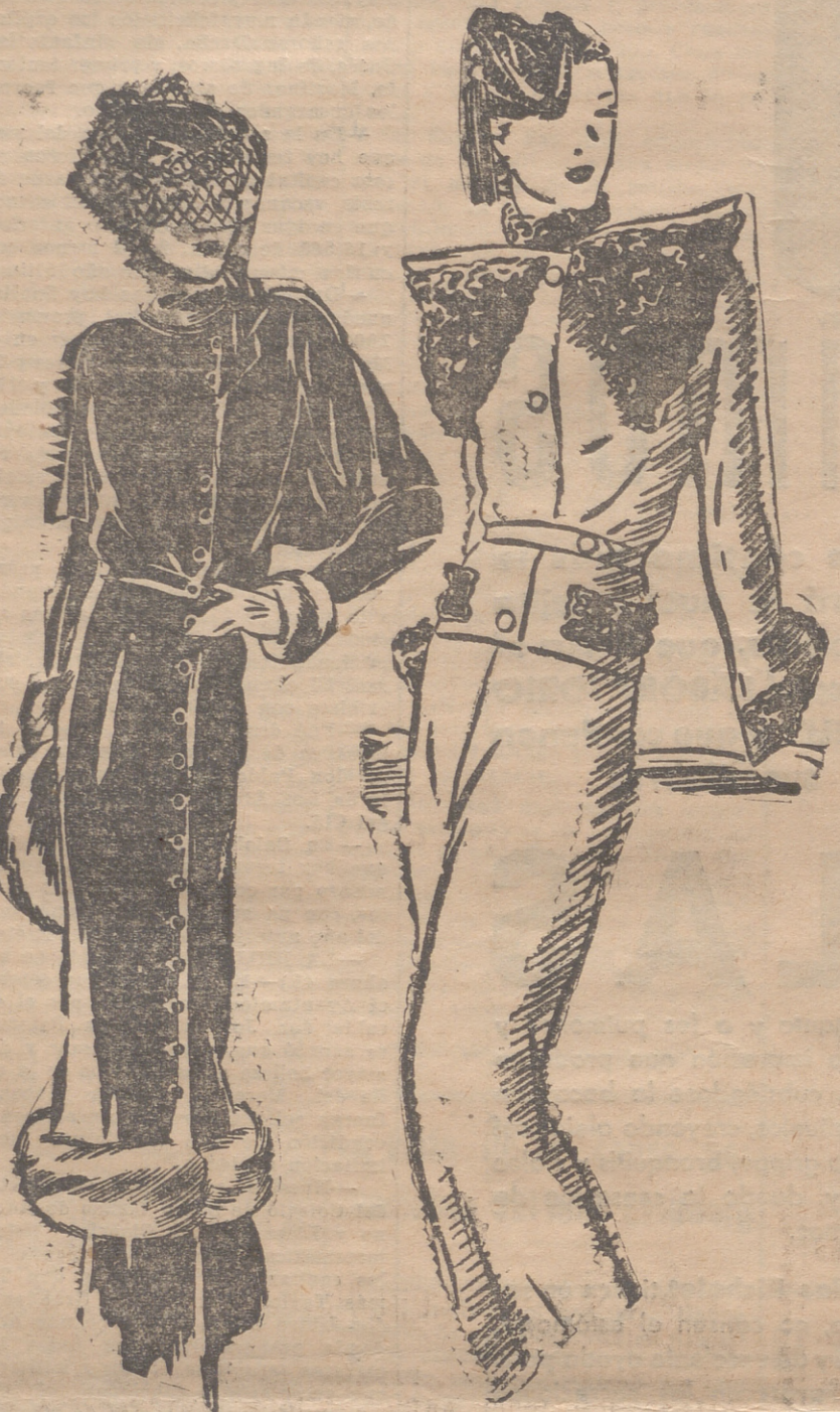
Conjunto de angorina negro, adornado con zorro azul. Sombrero de taffetas, adornado con camelias. Traje sastre, de lana roja, adornado con astrakán negro.