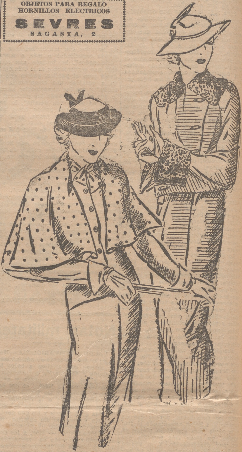
Traje de lana gris, con una capa postiza gris con motas lake. Sombrero bretón, de paja bengala con la copa de seda. Conjunto de raidjag gris, adornado con astrakán gris. El sombrero haciendo juego.

OBJETOS PARA REGALO HORNILLOS ELECTRICOS SEVRES SAGASTA, 2