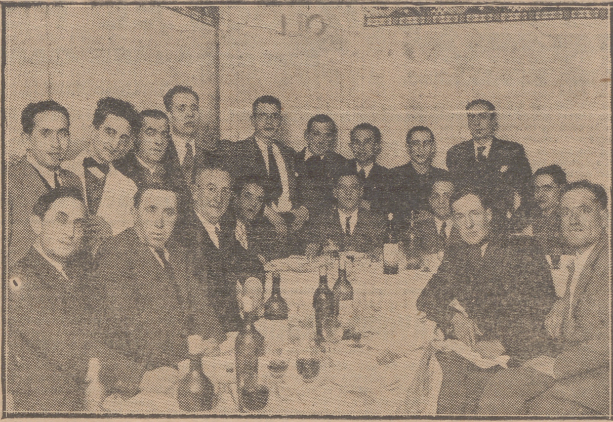
LAS DIRECTIVAS ENTRANTE Y SALIENTE DE LA VETERANA SOCIEDAD "LA AMISTAD", REUNIDAS EN BANQUETE