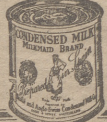
Pida hoy mismo a Sociedad Nestlé, (Sección F 57) Via Layetana, 41. Barcelona, un ejemplar gratuito del magnífico folleto ilustrado "Recetas La Lechera".